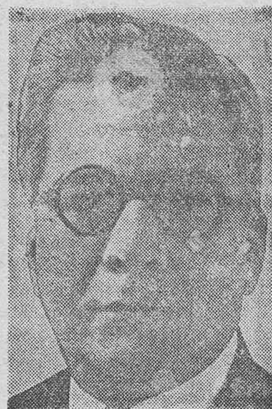
El presidente de Cuba, general Machado, contra el cual se han sublevado varias provincias, creándole una situación difícil.