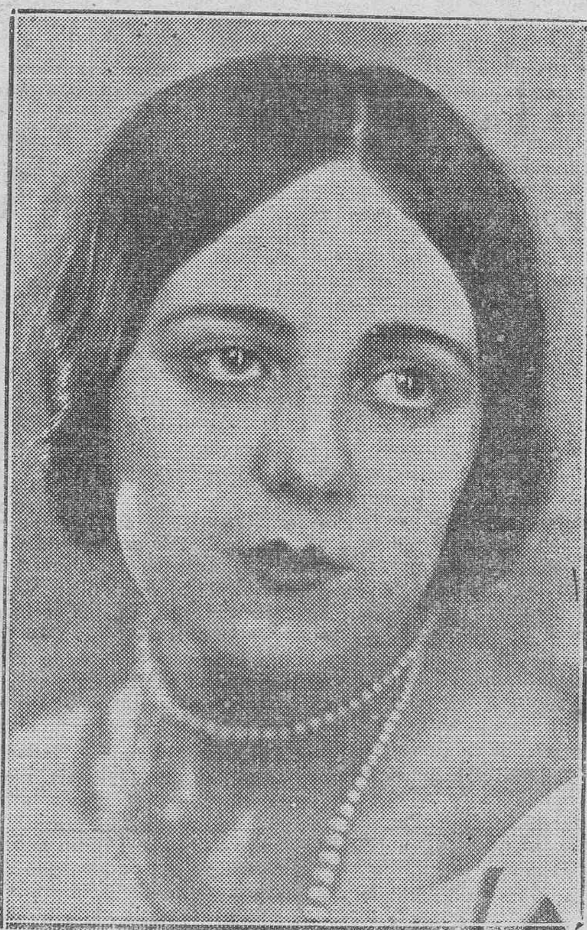
ARTISTAS CELEBRES.—ORIS ARANE