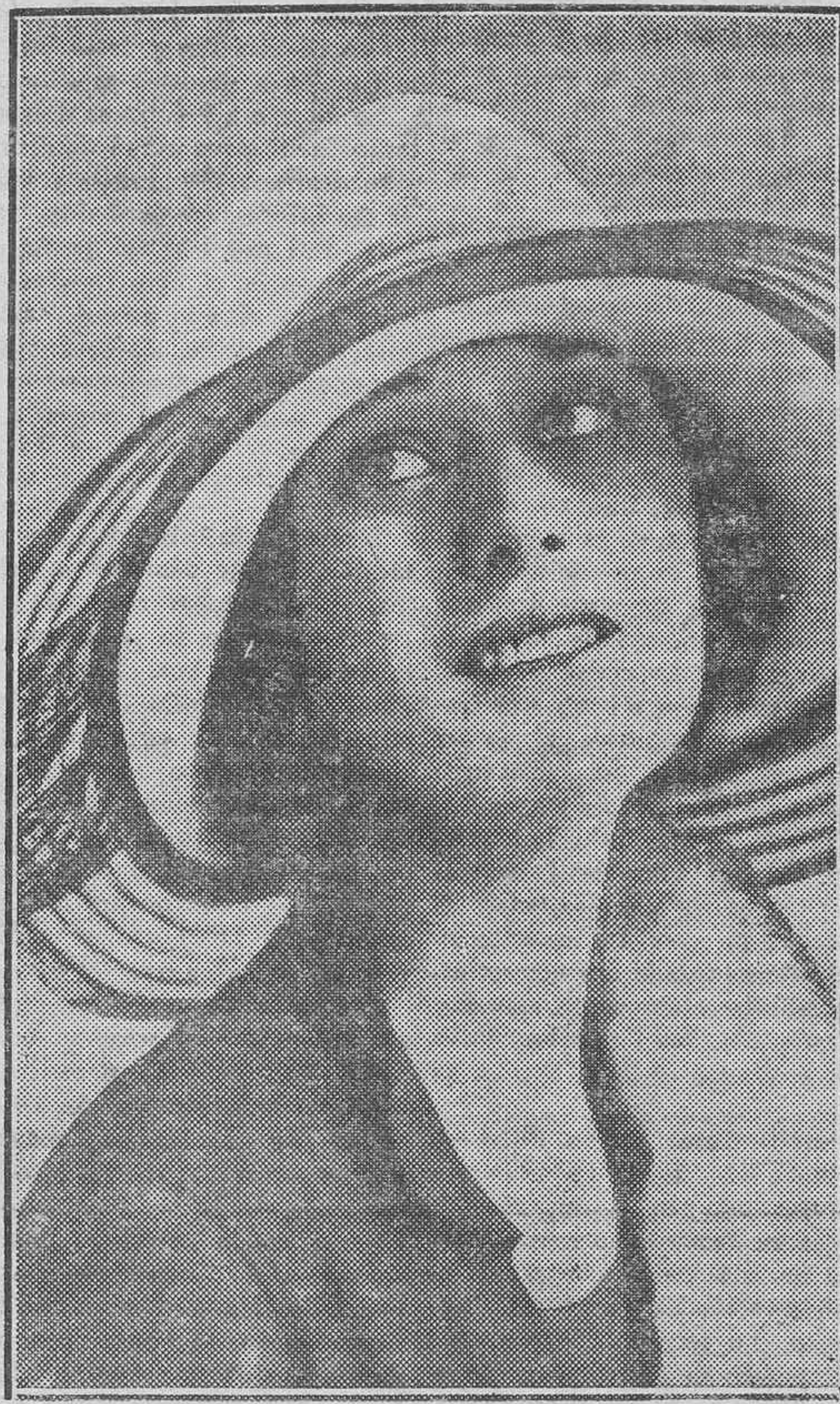
La popular artista de cine, Dolores Costello

Las Cortes Constituyentes de la República tienen, pues, trazada de antemano una trayectoria que permite un límite de anticipaciones. Anticipaciones de obra fecunda, duradera y completa. Les da su tónica (y la tónica es casi todo en una obra de ajuste nacional como la constituyente) el carácter intelectual de la inmensa mayoría de los diputados que eligió el pueblo.