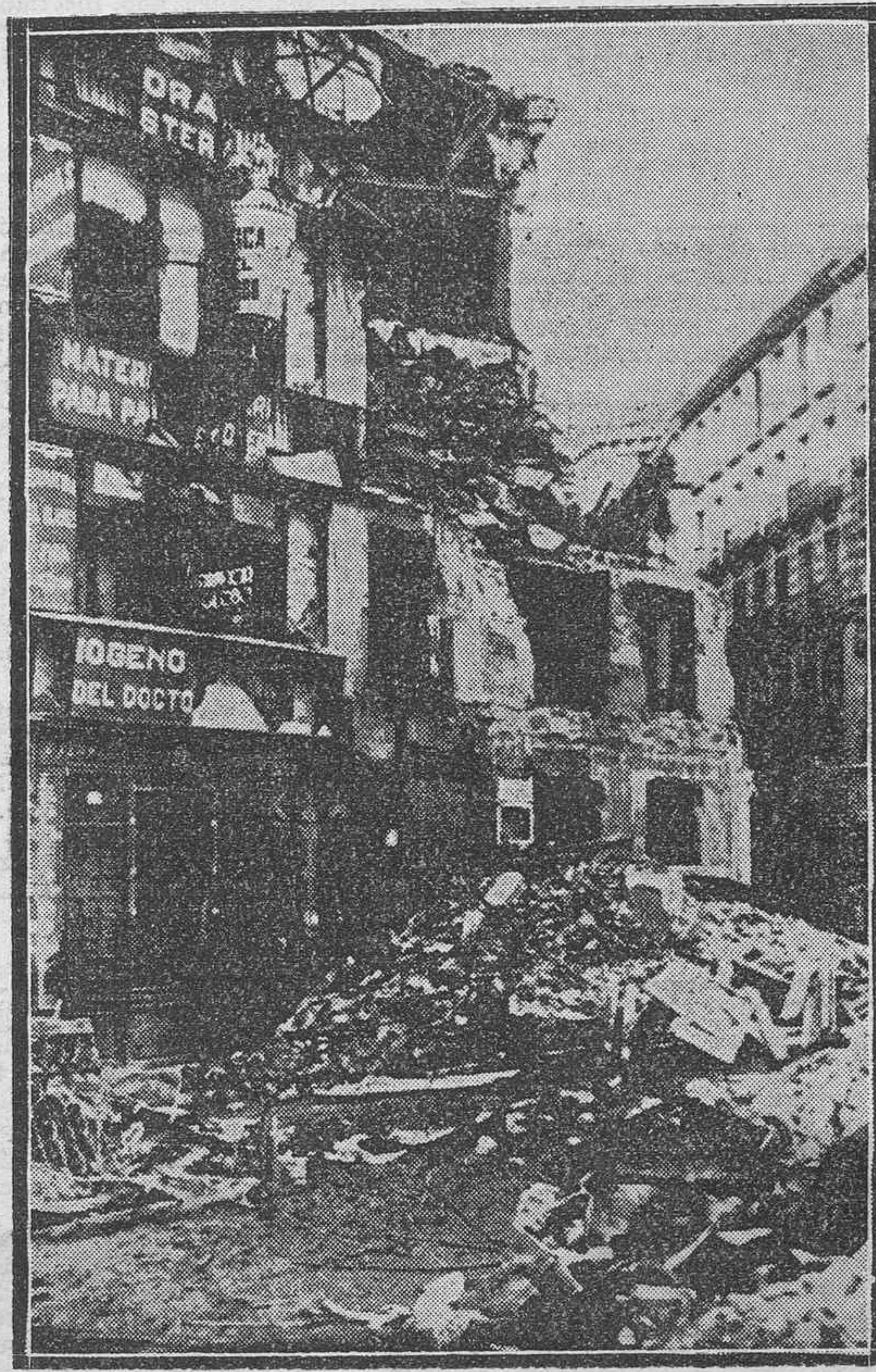
Efectos de una bomba de aviación nacionalista, en la plaza de Antón Martín, de Madrid, donde se hallaba una concentración roja.