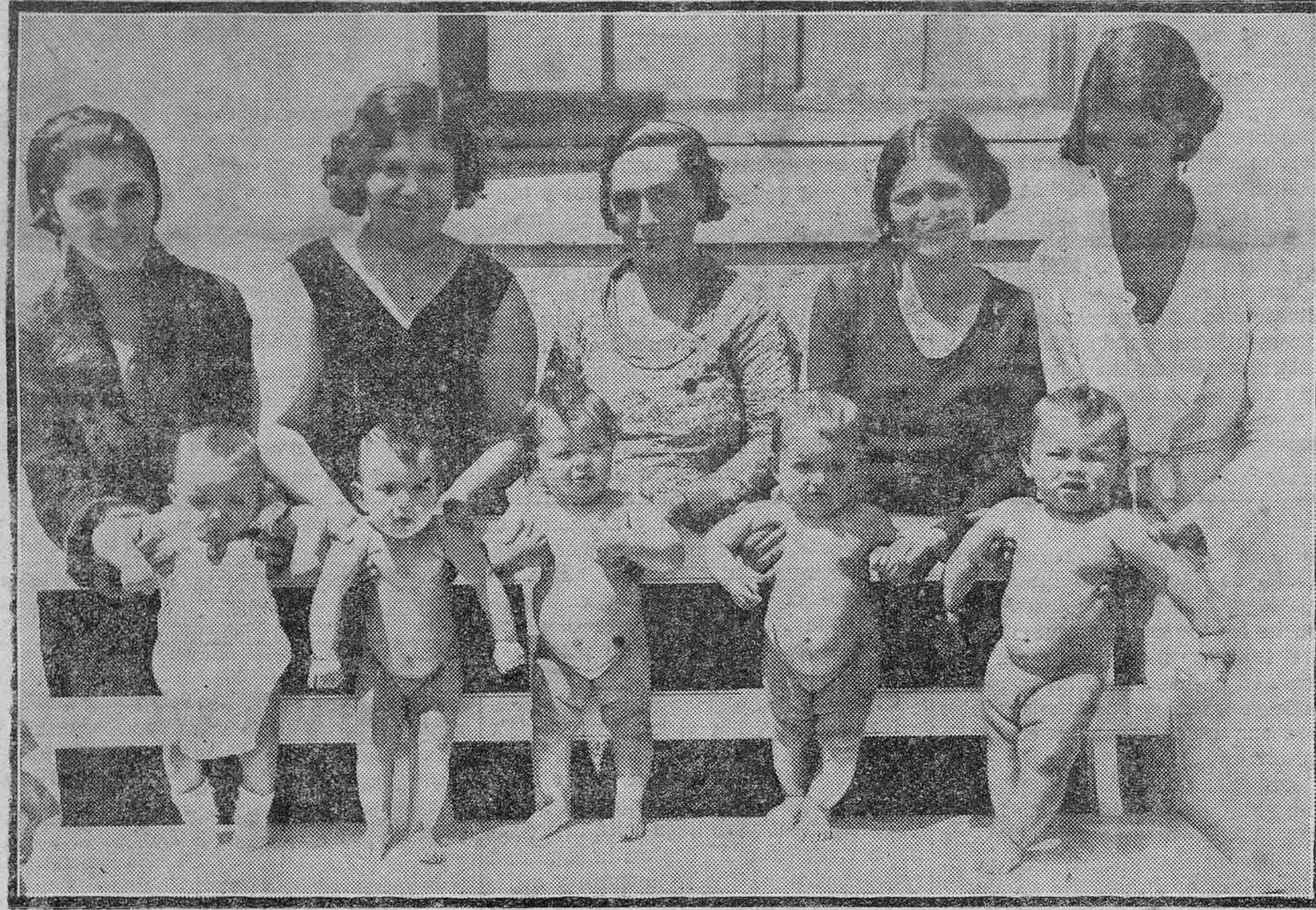
NIÑOS PREPARADOS PARA RECIBIR LA VACUNA EN EL INSTITUTO.

Lo que nos dice el Inspector de Sanidad, señor Vinuesa.—La mortalidad infantil en Tenerife supera a la de Hungría.—Labor y planes de la Institución