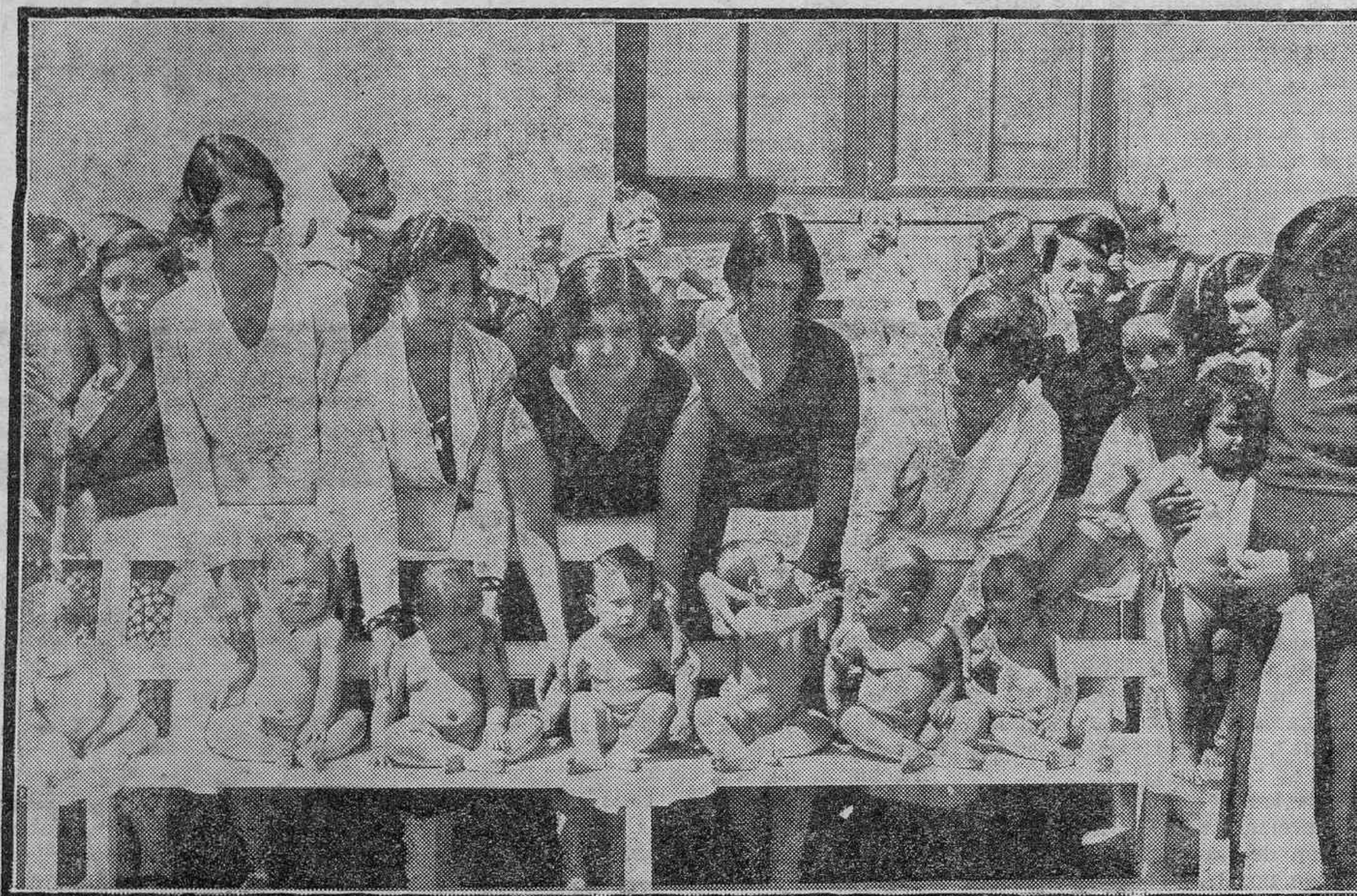
OTRO GRUPO DE NIÑOS EN LA INSTITUCION DE PUERICULTURA.