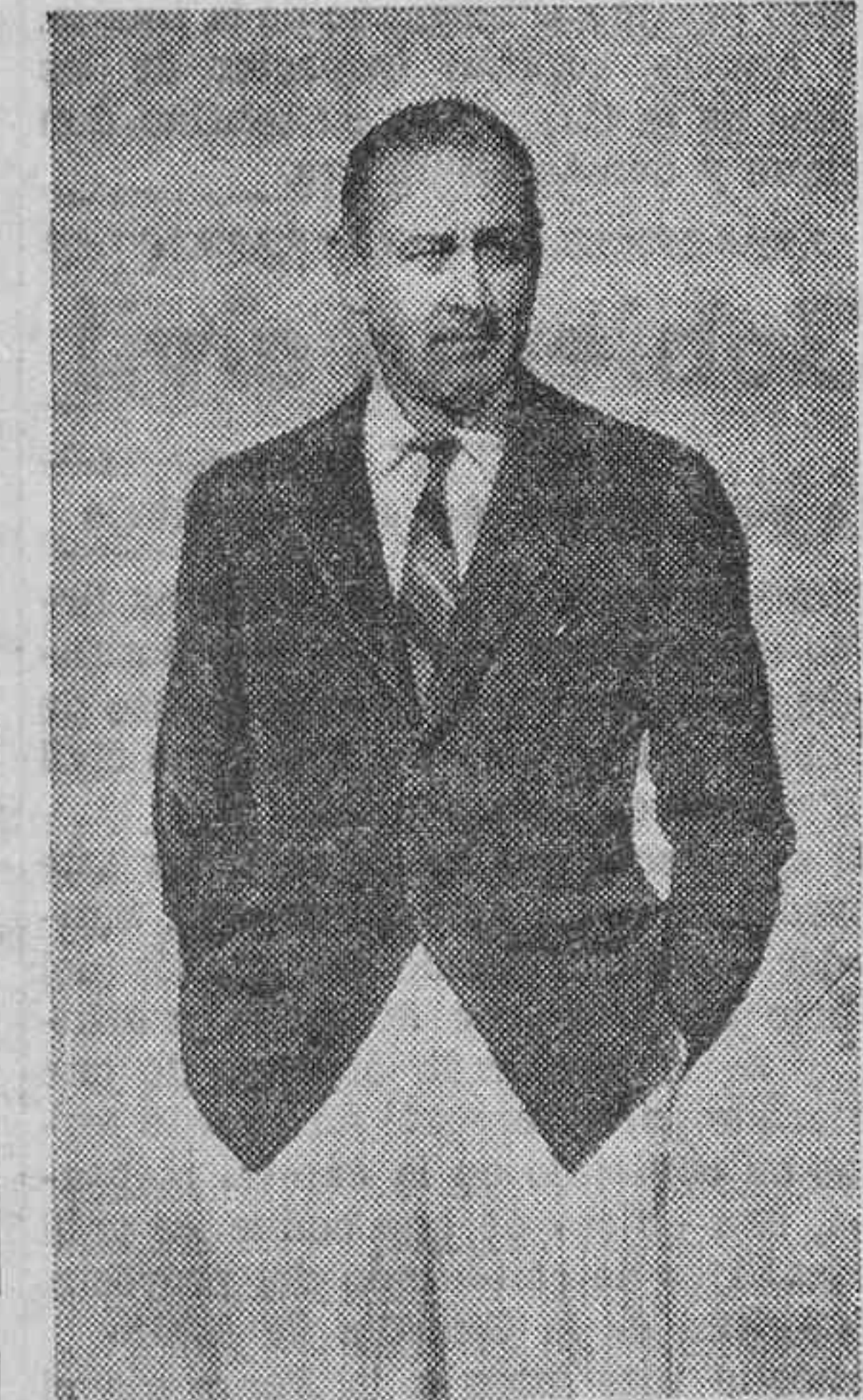
El gran astro americano obtiene en la producción "El idolo", que hoy estrena el Royal Victoria, uno de sus más definitivos éxitos