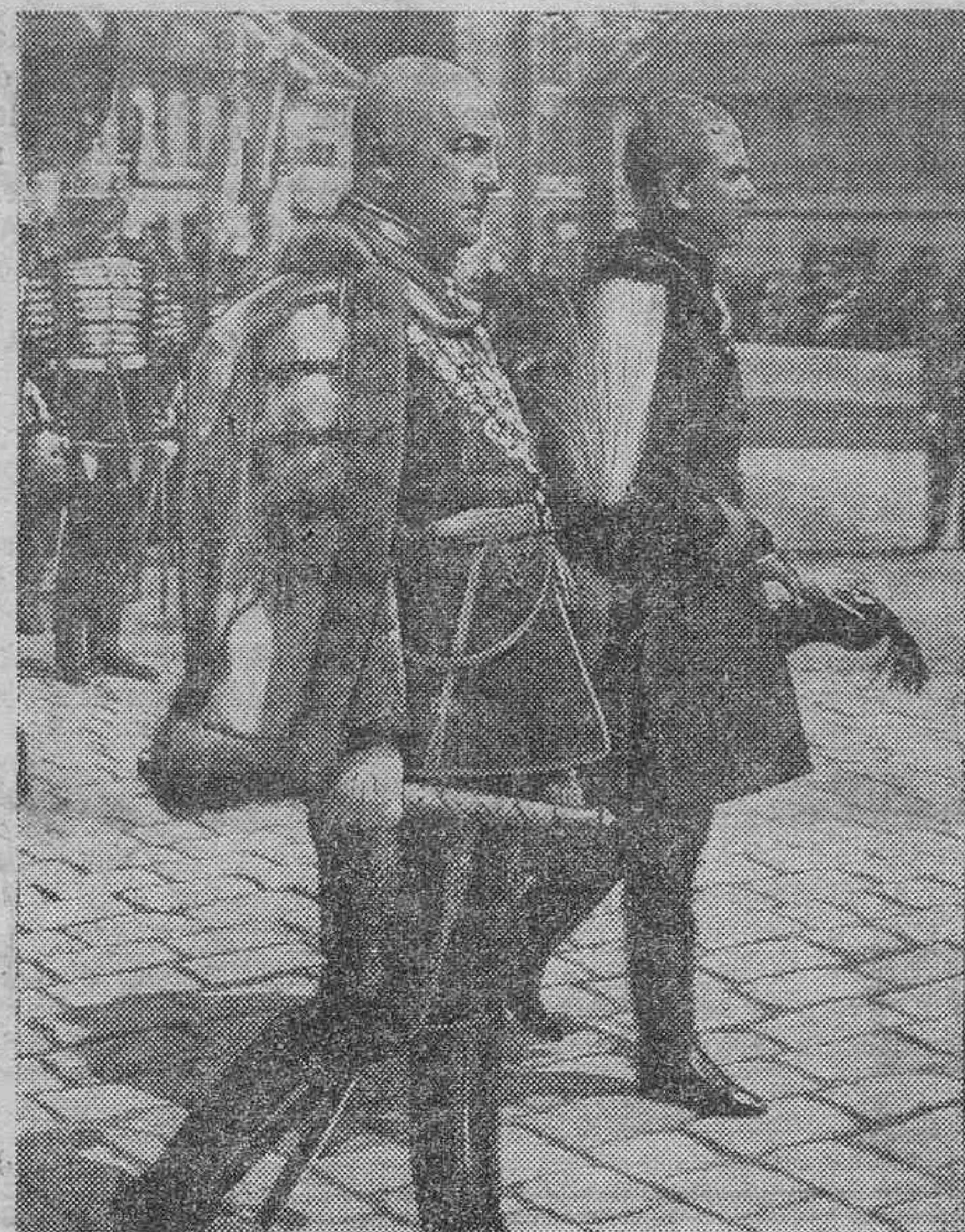
El archiduque José y el príncipe Alberto, de Hungría, en la procesión cívica que se celebra anualmente para conmemorar la festividad de San Esteban.—Campesinas de Checoslovaquia. Una vendedora ambulante.