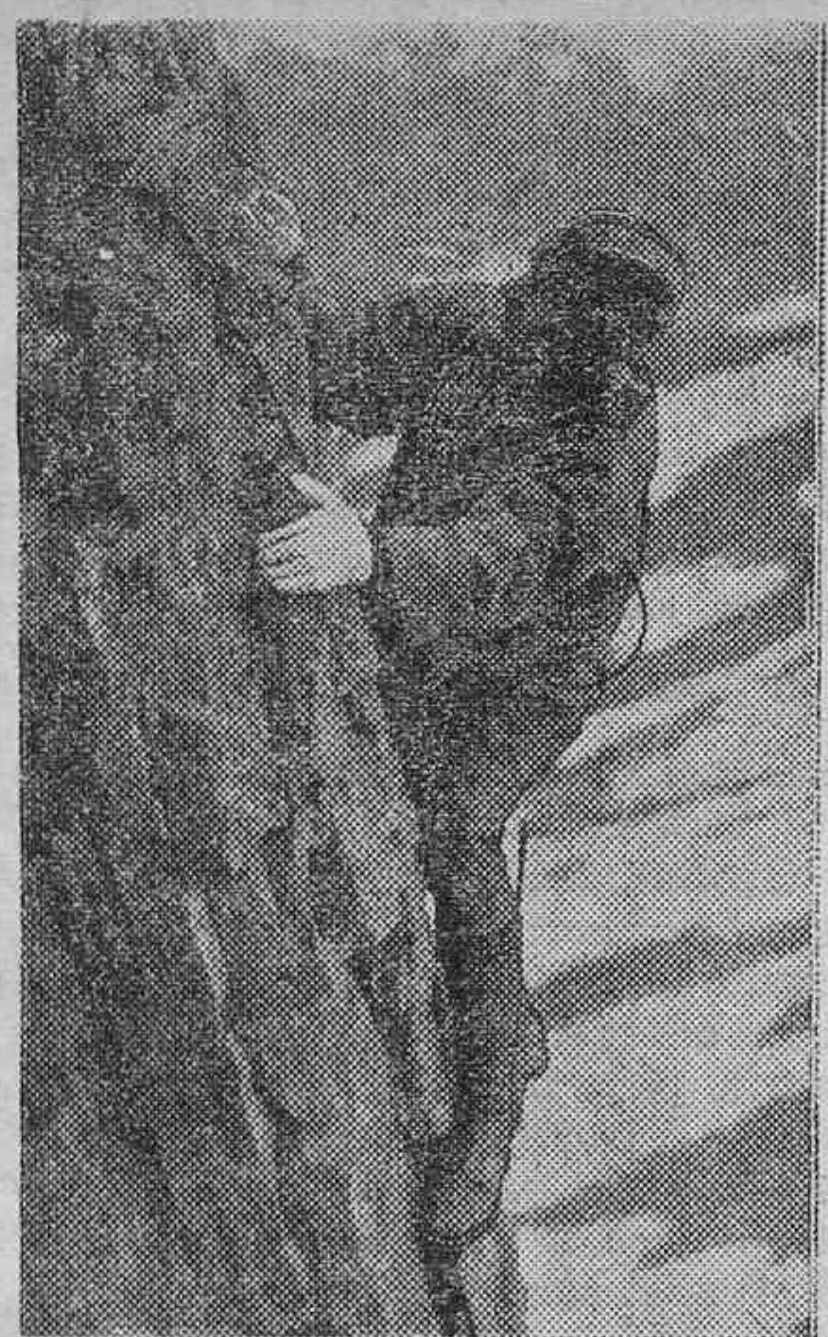
Un jugador de rugby, americano, que ha participado en una expedición a Alaska, ha descubierto que el yelmo de rugby no sólo es bueno para las pistas de fútbol, sino que ventajosamente puede emplearse para la subida de montañas como protección contra las piedras que caen.