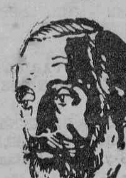
El señor Cambó ha hecho interesantes declaraciones sobre la política que debe seguirse en los actuales momentos.