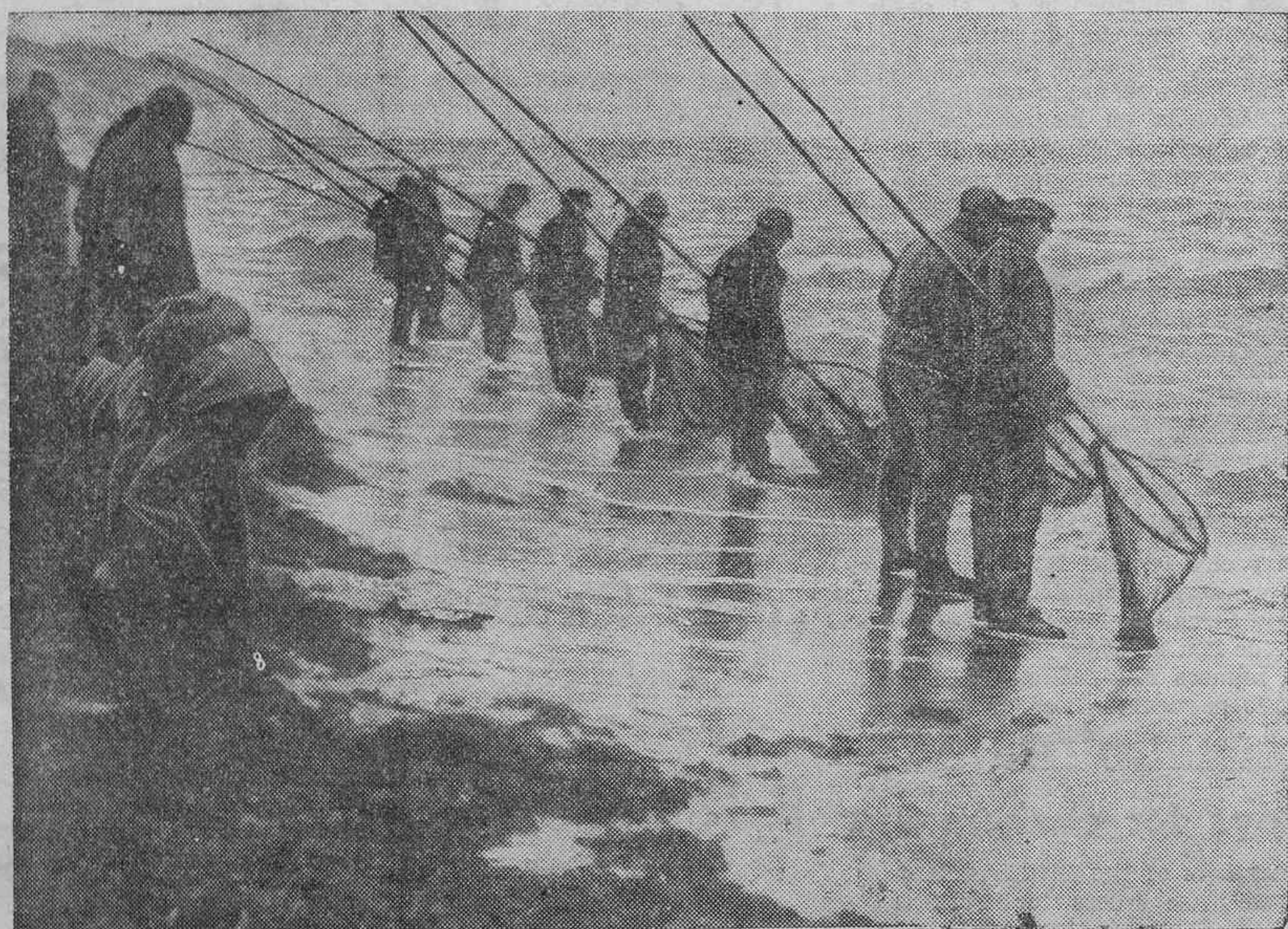
RECOGIENDO AMBAR.—En ninguna parte se encuentra el ámbar en tan gran cantidad como en la costa de la Prusia Oriental, y en la fotografía se ven pescadores recogiendo esta preciosa resina de bosques primitivos que hace miles de años se hundieron en el mar.

—Pero—le interrumpió Verlaine—¿quién les ha dicho a ustedes que el ajenjo se ha hecho para los perros?