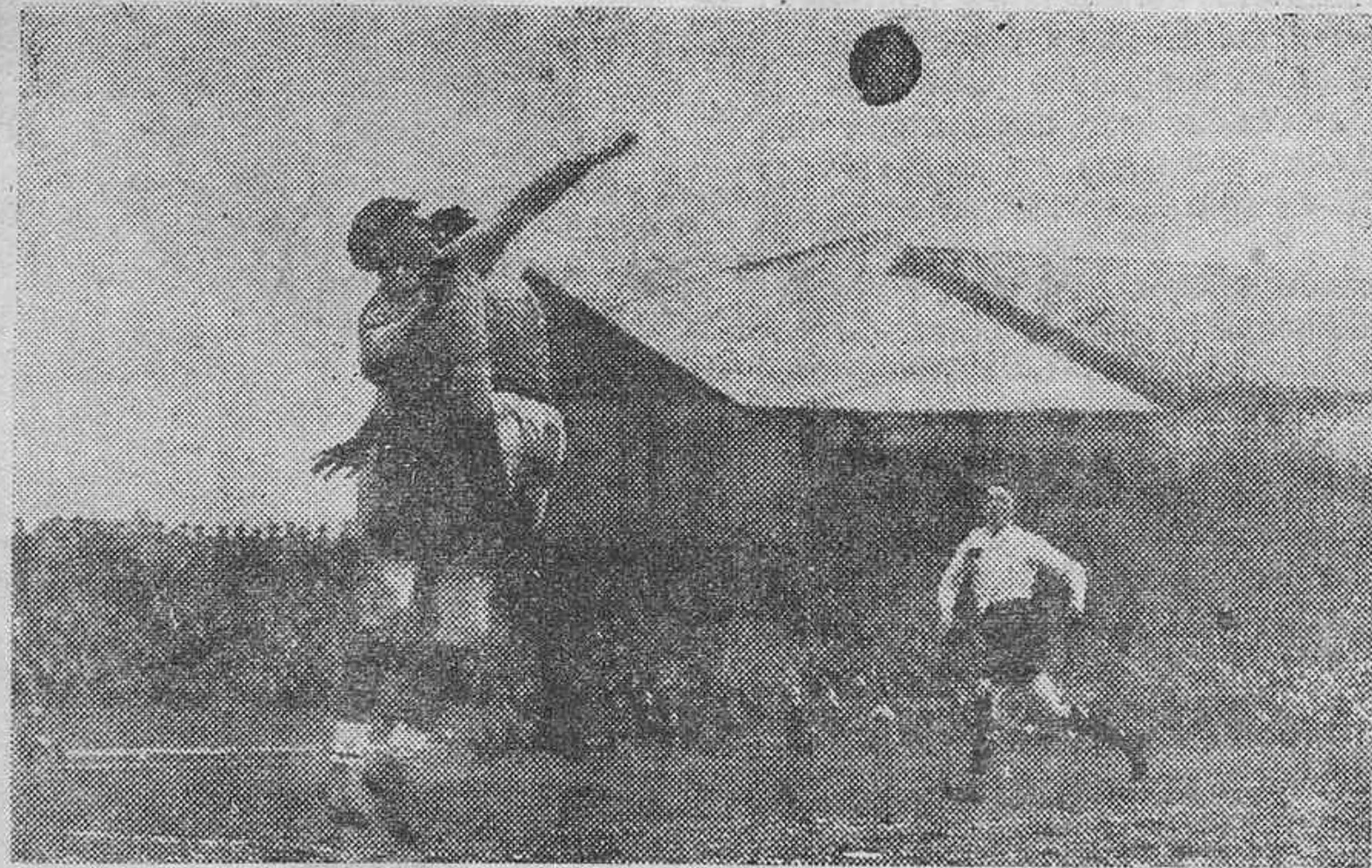
Detalles del campo de Highbury, donde esta tarde se celebrará el partido Inglaterra-Italia. La "foto" de la derecha representa una parada de Zamora durante el encuentro que los españoles jugaron frente a la selección británica el año 1931.