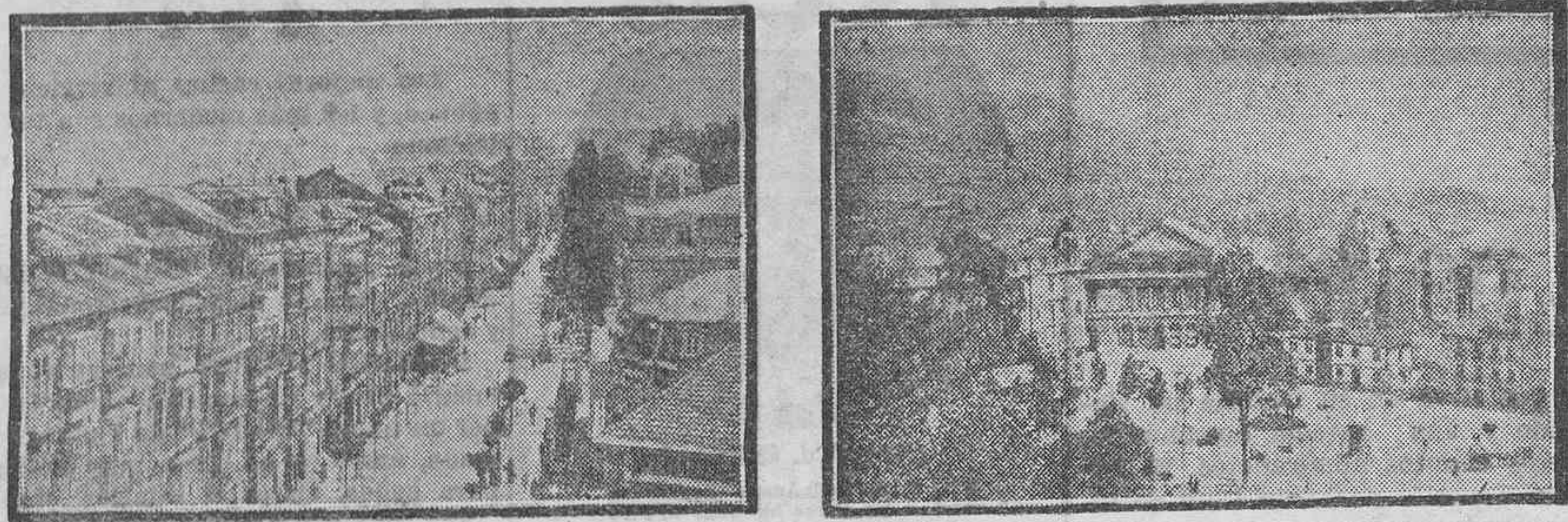
OVIEDO.—Una vista parcial de la población.—Plaza del 27 de marzo, en la que se halla el Teatro Campomanes.