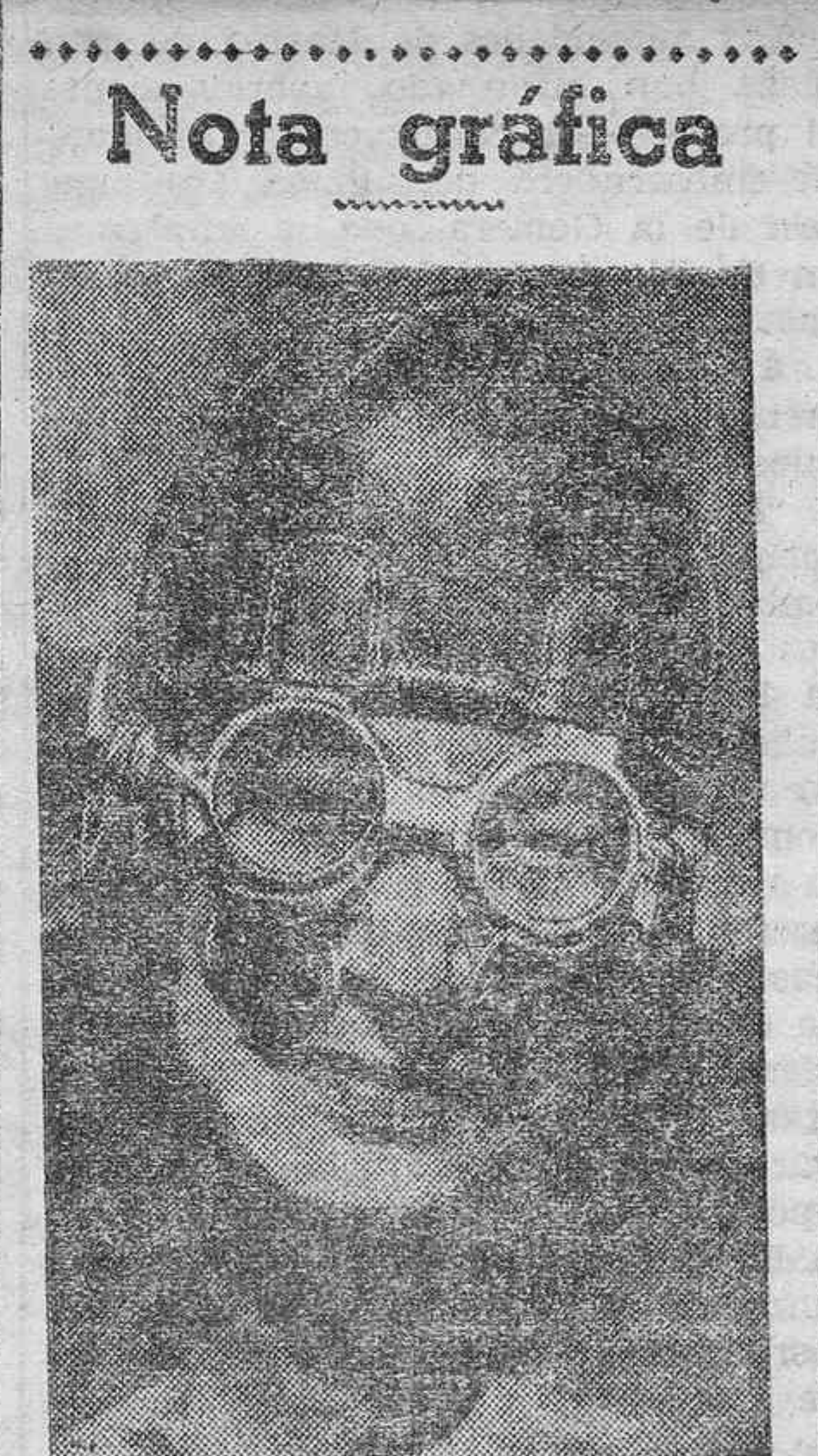
El jugador de "rugby" de fama mundial Tom Sasaki.