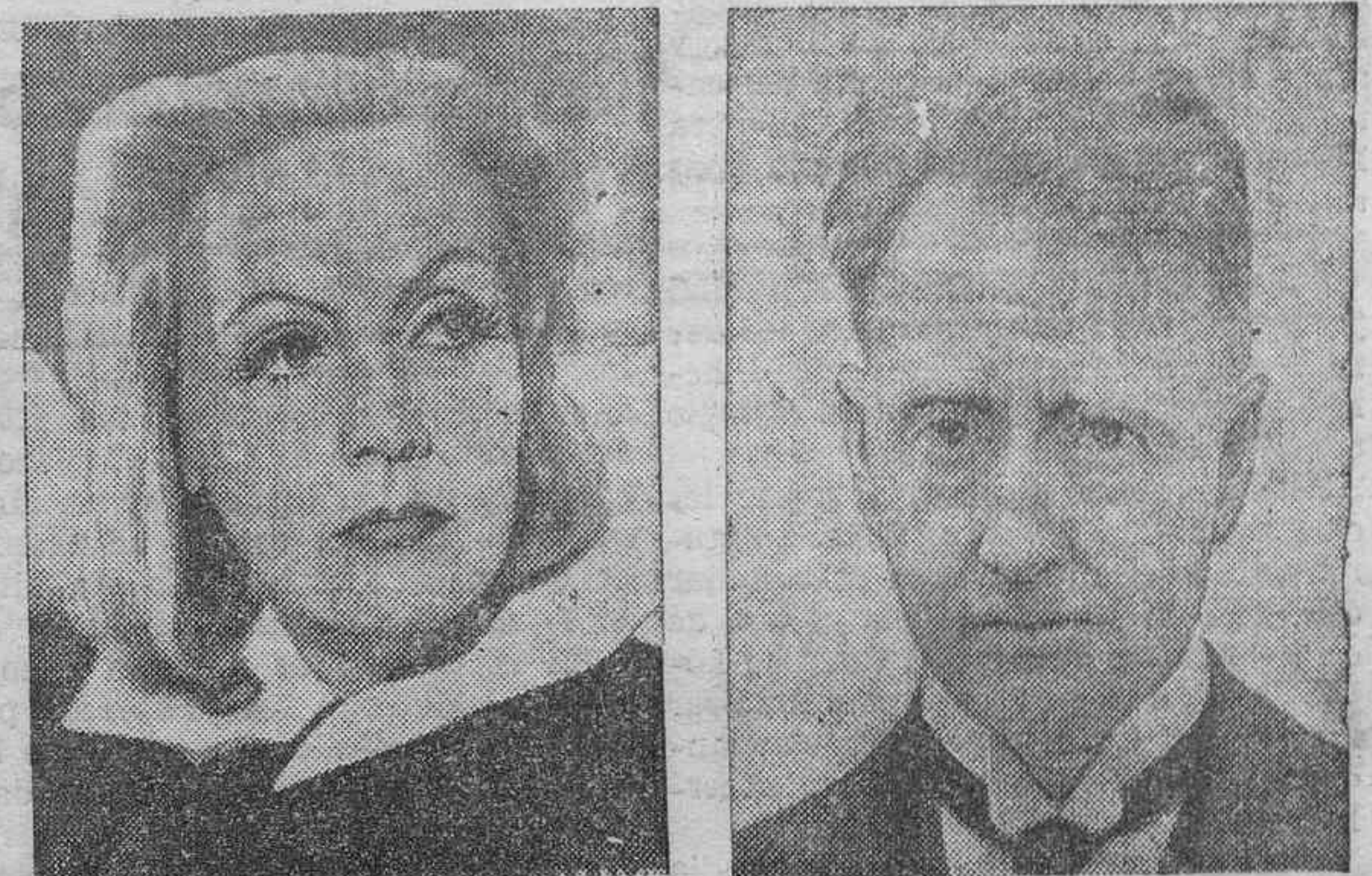
SILUETAS DE ACTUALIDAD.—Upton Sinclair, famoso autor americano, que ha sido elegido candidato por los demócratas para la elección de gobernador en California.—La célebre artista Greta Garbo, que acaba de celebrar su décimo aniversario en el cine.—El antiguo presidente de Irlanda, Cosgrave, que ha sustituido al general O'Duffy en la oposición contra el presidente De Valera.