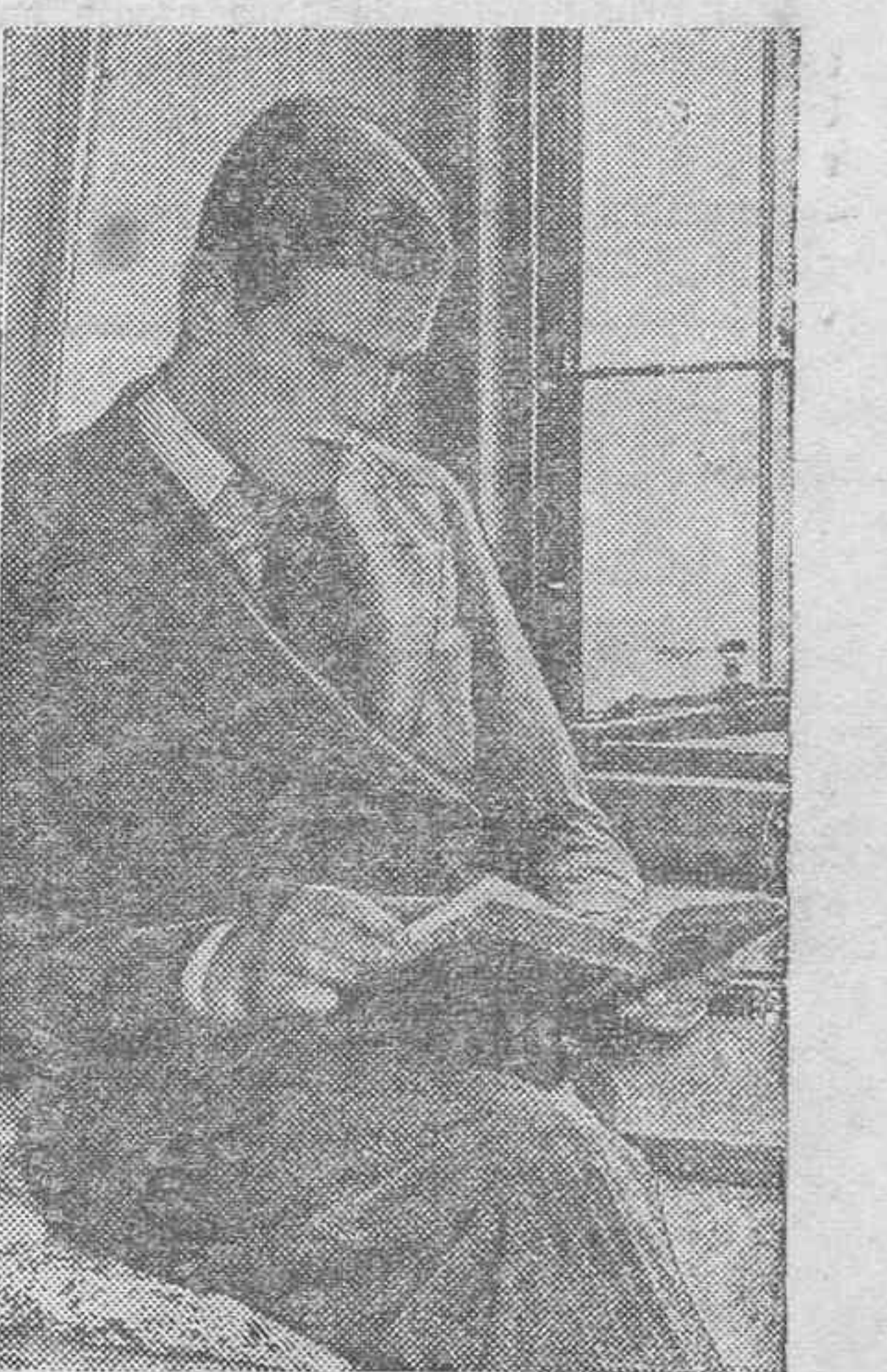
Mr. Roudolph Churchill, el hijo de 23 años de Winston Churchill, que ha sido presentado candidato en una elección parcial. Con ello sigue el ejemplo de su padre que desde muy joven comenzó a actuar en política.