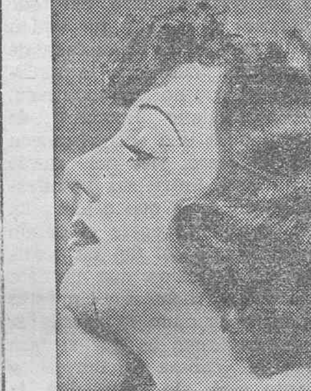
El rostro de Ann Dvorak, encantadora estrella de Warner Bros., es un óvalo perfecto. Por eso luce tan bien con cerquillo. Fíjese en la trenza. ¡Ultra moderna!

La mujer de facciones irregulares —nariz larga y barba pronunciada— debe evitar los peinados demasiado lisos. Su rostro necesita un peinado muy femenino, y haría bien en partirse el cabello a un lado, marcarse las ondas