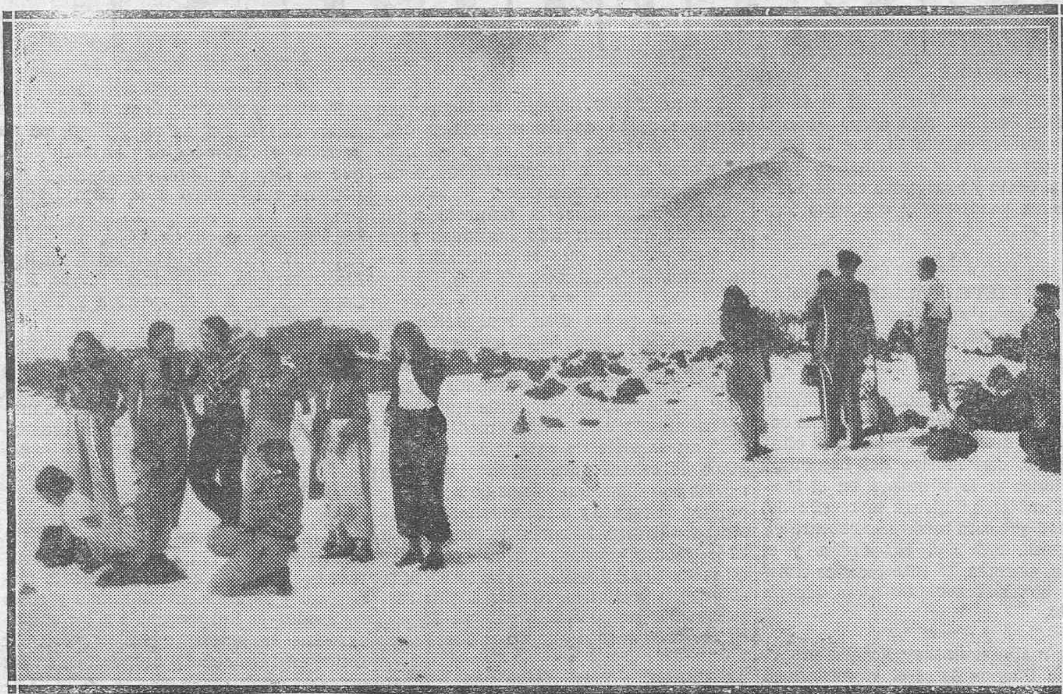
Grupo de alumnos del "Paedagogium Tenerife", en las Cañadas, durante su última excursión a esta región nevada.

La inmensa riqueza pictórica que Las Cañadas encierran después de una nevada, no queda hoy día solamente al alcance de las personas mayores, sino para la juventud, sedienta de belleza y con el espíritu lleno de un sentido deportista que quiere conquistar también las regiones por lo regular inaccesibles.