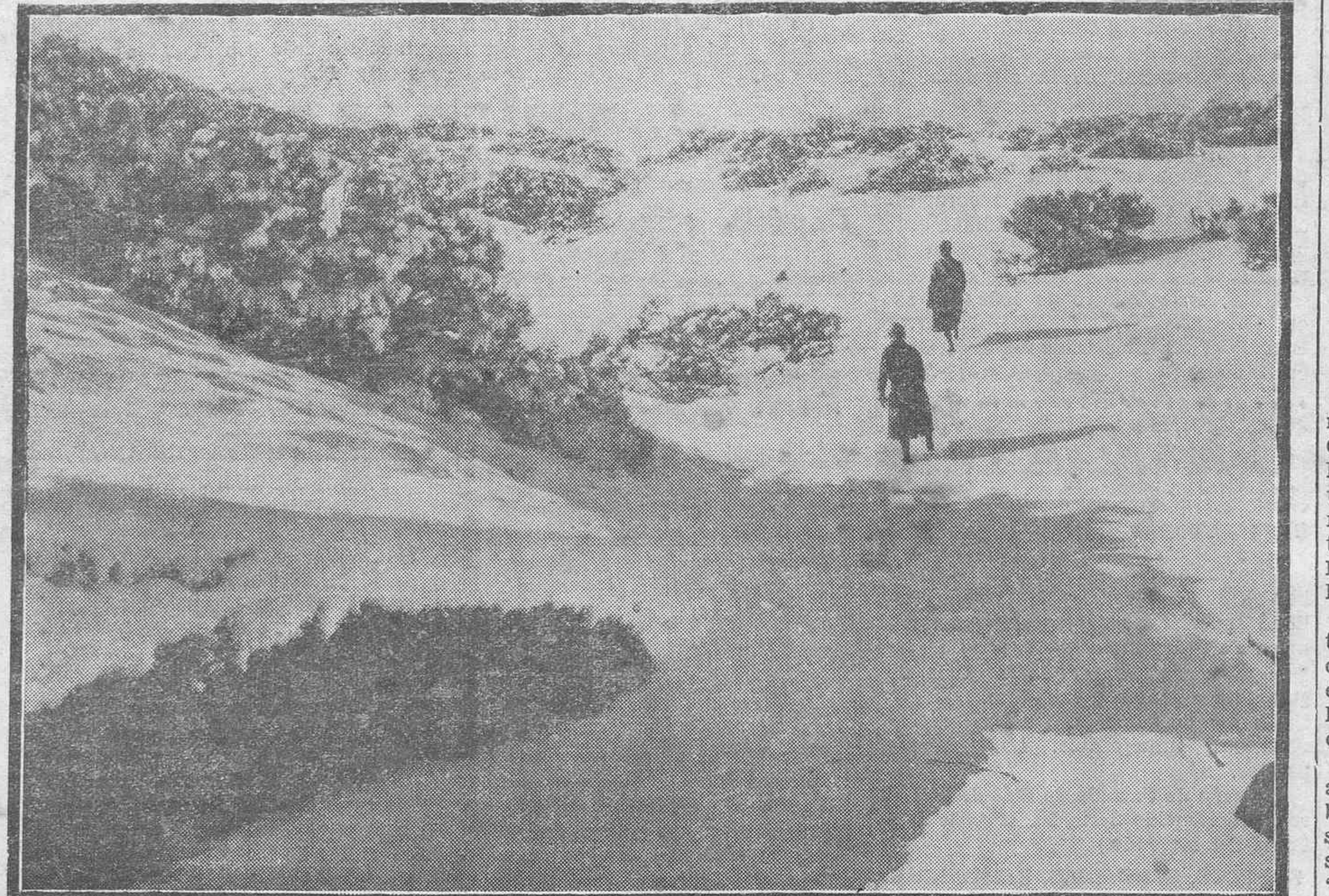
GRANDES NEVADAS EN EL TEIDE.—Un aspecto de Las Cañadas.