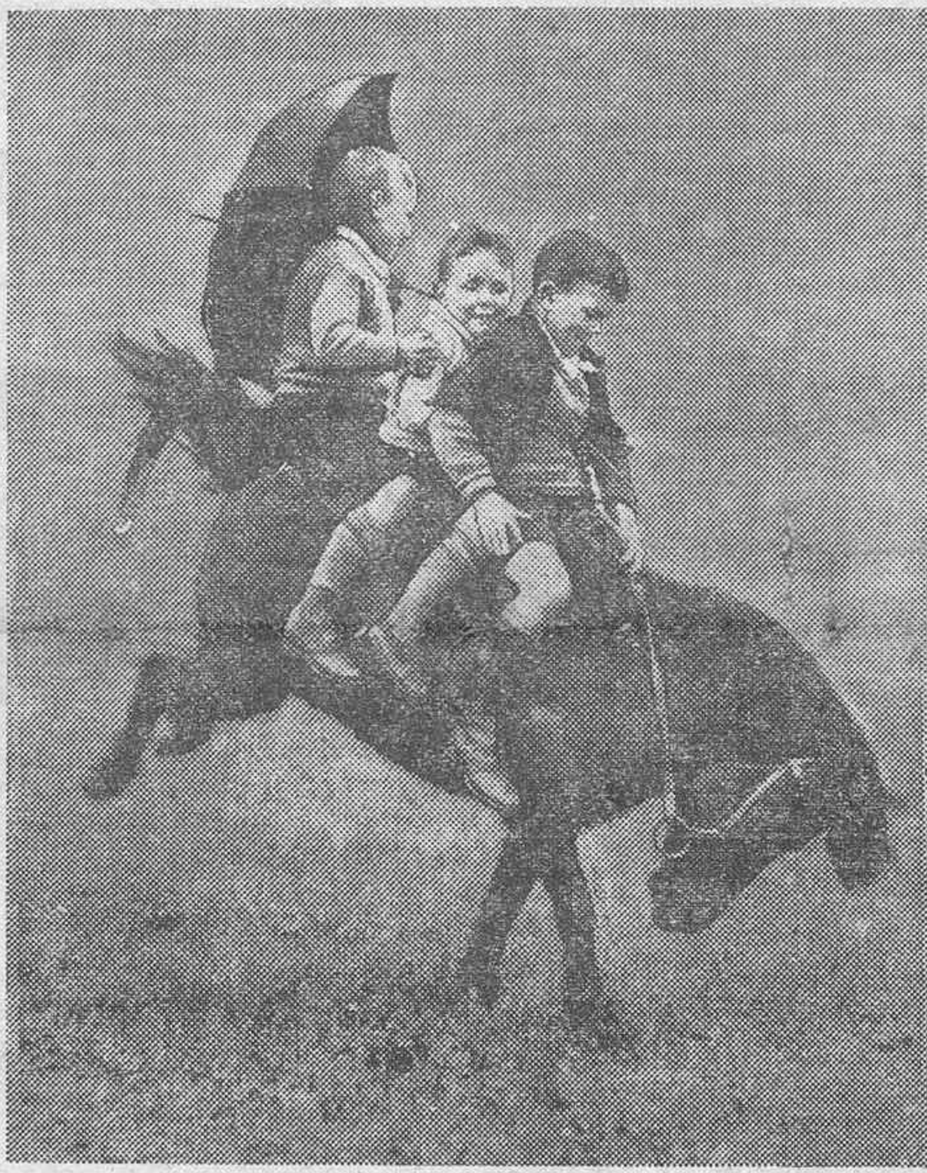
Tres pequeños "cowboys" australianos en una exhibición de "El Rodeo", deporte mejicano actualmente muy en boga.