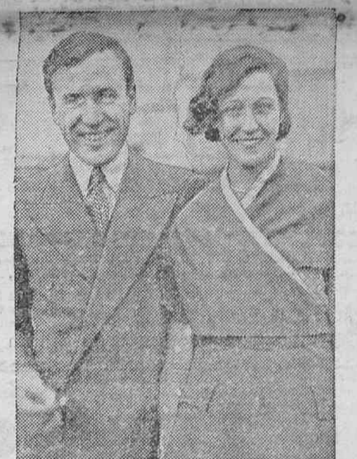
Amy Johnson—la famosa aviadora, con su esposo, Mollison, también célebre aviador inglés.

Amy Johnson ya en 1930 atrajo la curiosidad del mundo entero