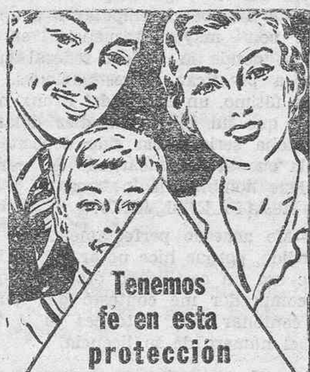
Tenemos fe en esta protección contra la piorrea