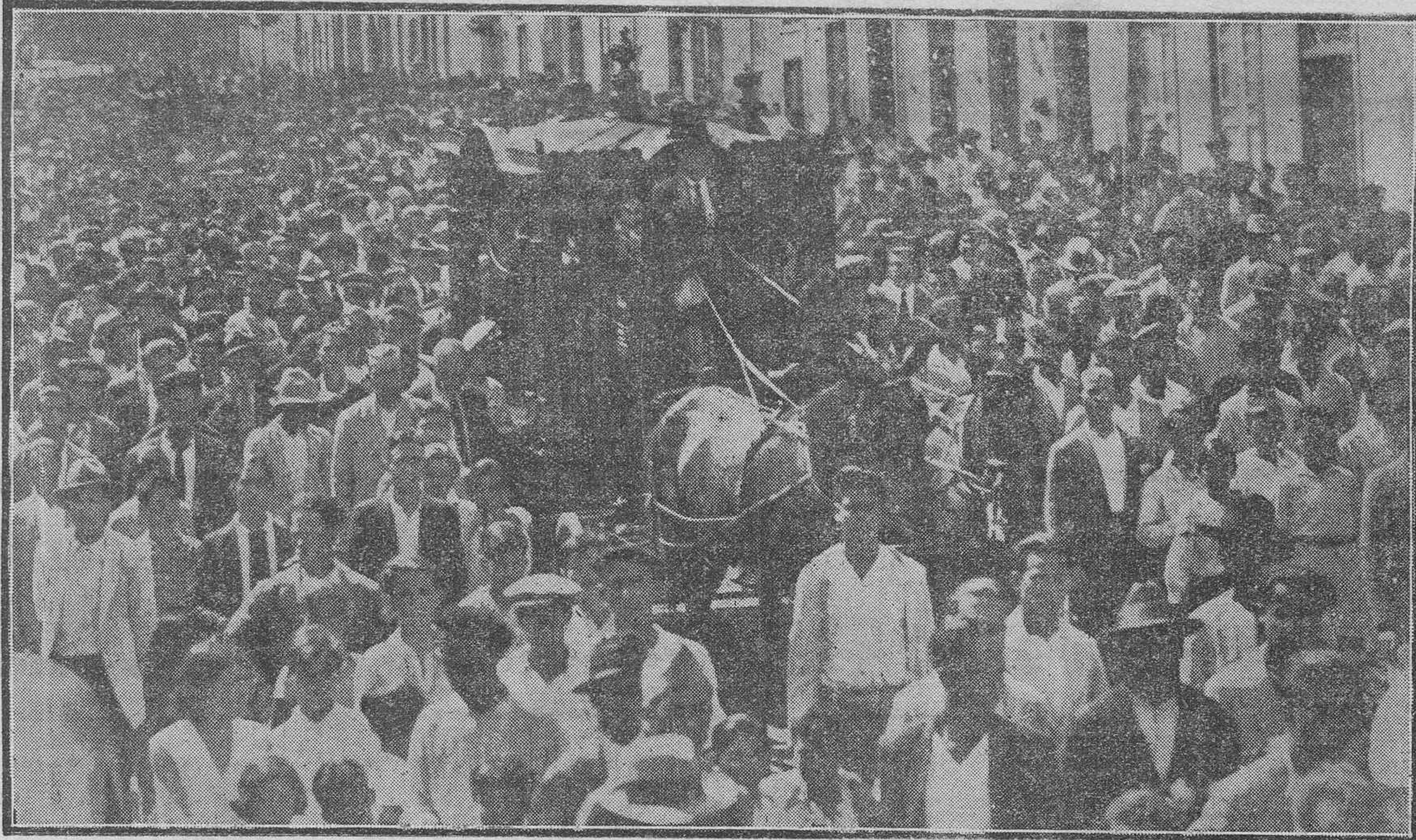
Un detalle de la manifestación de duelo celebrada ayer tarde con motivo del traslado de los restos de las víctimas.

Durante el trayecto observamos que las numerosas mujeres que acompañaron a los difuntos hasta su última morada prorrumpían en sollozos. El acto fué de una enorme emoción, que puso de relieve el hondo y general sentimiento que ha causado en todas las clases sociales la trágica muerte de las desdichadas víctimas.