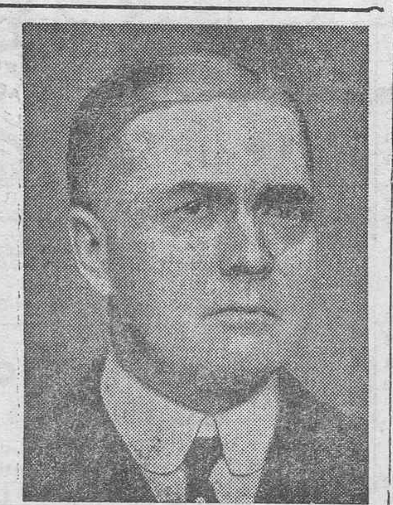
Evangelina Booth, la hija del fundador del Ejército de la Salud, general William Booth, que se indica para sustituir a éste en el cargo que desempeñaba.—El Dr. John R. Mott, presidente de la Asociación mundial de Jóvenes Cristianos, que ha sido propuesto para el premio Nobel de la Paz de 1934