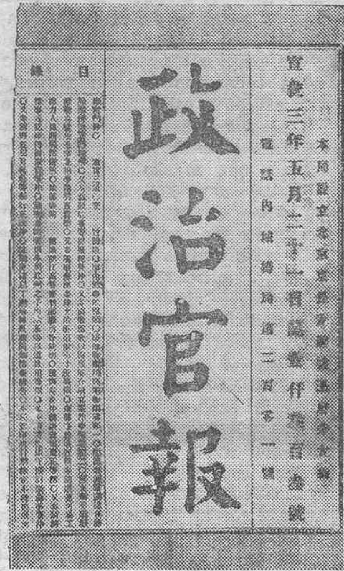
LA ACTUALIDAD GRAFICA.—Una página del más antiguo diario de la China y del mundo, que ha dejado de publicarse después de 1.535 años de existencia.—Mauren O'Sullivan, la joven irlandesa que se ha revelado como una de las primeras figuras del cine.—El telecinema, aparato de nueva invención que se exhibe en la Exposición anual de radio de Berlín, tomando fotografías de varias escenas de la apertura del gran certamen, que fueron transmitidas por la estación de televisión a Witzleben.

origen francés. Tiende además aludido Decreto a una distribución del contingente total que se asigna a Canarias entre aquellos países con los que se concierten tratados o convenios en los que se den mayores facilidades para introducción y consumo de los frutos de esa. Por estimar conveniente conocer la opinión de esa entidad, así como reparar si fuese necesario y oportuno hacerlos, solicitaré aplazamiento resolución Consejo ministros hasta próxima semana. Salúdoles. Ministro Obras Públicas." Como se ve, el paso que ahora se inicia debido a la imposición de los productores franceses, seguirá luego impulsado por las pretensiones de los exportadores de todos los países. Los productores peninsulares, con más razón que ninguno, exigirán también del Gobierno un régimen de protección para sus envíos a Canarias, y con ello las franquicias se convertirán en aduanas para mal de la economía de nuestras depauperadas islas. Sabemos que la Cámara de Comercio de Las Palmas se ha puesto ya en contacto con las entidades comerciales de aquella provincia y con la Cámara Oficial de Comercio, Industria y Navegación de Tenerife, y por ello no creemos necesario insistir en el asunto. Ya saben los organismos más directamente afectados por el problema que a nuestra economía va a plantearse, lo que hay de gravedad en el asunto. De sus gestiones y de la comprensión del Gobierno surgirá la solución que resuelva el conflicto sin menoscabar los legítimos derechos adquiridos por Canarias.