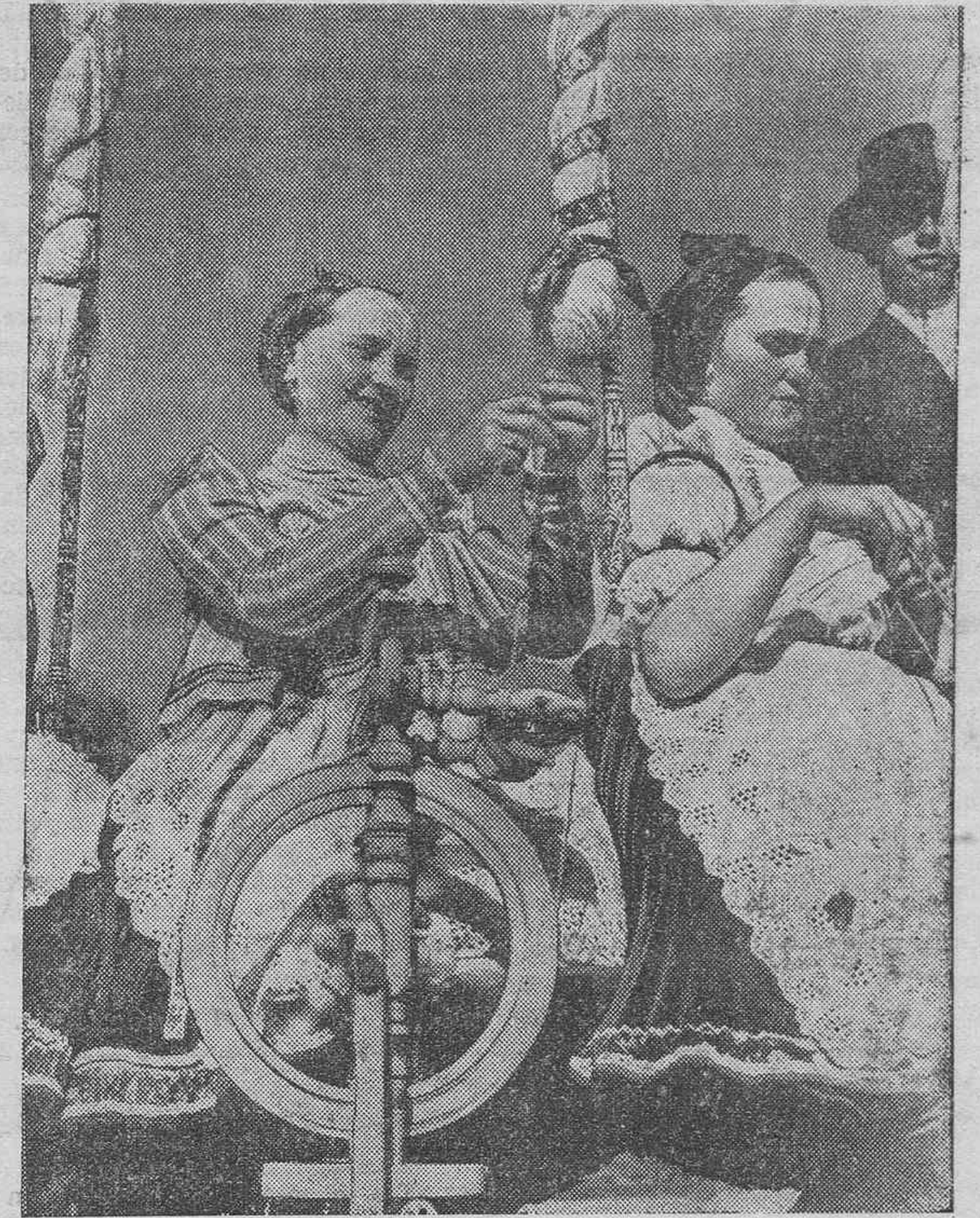
EN ALGUNOS PUEBLOS DE HUNGRÍA SE CONSERVA LA VIEJA COSTUMBRE DE HILAR. HE AQUÍ A DOS HUNGARAS CAMPESINAS CONFECCIONANDO SUS TÍPICOS TRAJES SIN PREOCUPARSE DE LOS MODERNOS TELARES NI DE LAS MODAS PARISINAS.

No me admiró que olviden a una calle llamada la "República". Algo más me admiró la noticia de su arreglo, al no puede sospechar.