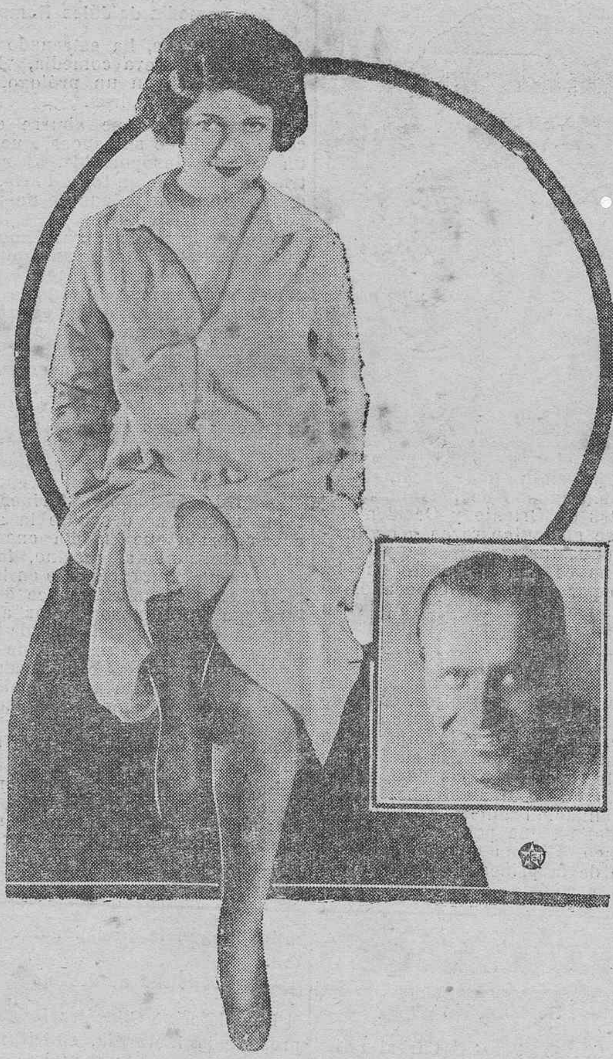
Merna Kennedy y James Hall, famosos artistas de la pantalla

Yo me permito hacer un llamamiento a las autoridades y a las fuerzas vivas del país para que, con la rapidez que el caso requiere, se dirijan al Gobierno y le supliquen el envío de dos transportes de guerra que devolvieran al solar isleño a nuestros hermanos, ya que esto es más humanitario y de más justicia que la de haber enviado un crucero a la reelección de un Presidente al que hoy el mundo entero y entre estos, los intelectuales españoles, protestan de su proceder y del látigo que estalla contra su pueblo, contra los intelectuales, clase estudiantil que tiene cerrada su Universidad desde hace tres años, y encarcela a los prohombres que han regido los destinos de la bella Cuba con a-