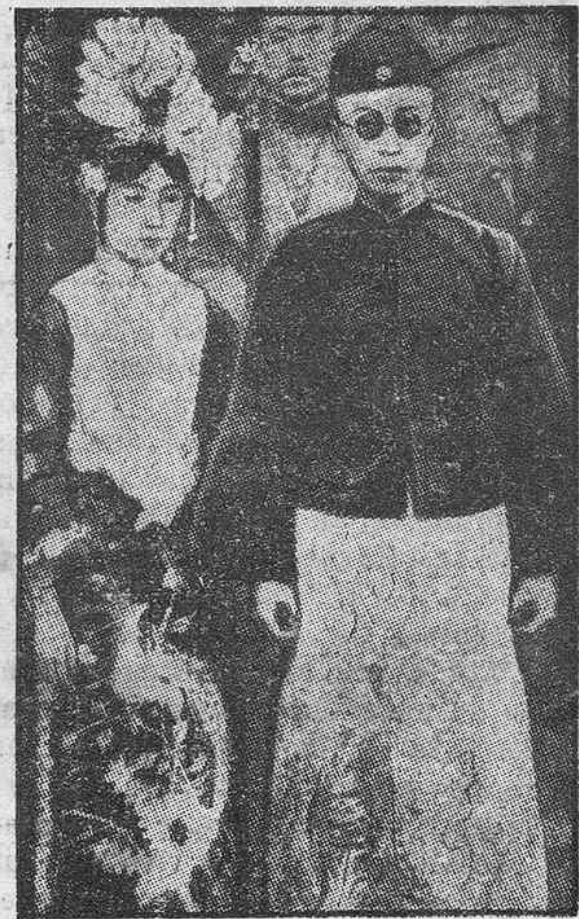
Henri Pu-Yi y su esposa, nuevos emperadores de la Manchuria.—Una japonesita de aristocrático linaje

Por otro lado, la industria belga está buscando la manera de comprimir los precios de costo en vista de todas las trabas que ponen a la exportación los otros países competidores.