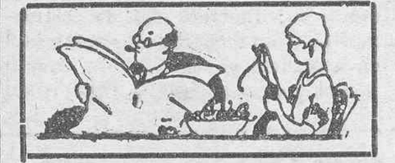
LEYENDO LA PRENSA

Después de una sesión tormentosa, la Cámara acordó eliminar de las discusiones parlamentarias la cuestión del descubrimiento de América. Se aprobó una resolución mediante la cual se concedía un crédito de 50.000 dólares para erigir una estatua conmemorativa del escandinavo Laif Ericson, del que afirmaron sus compatriotas que descubrió América en el año 1000, y finalmente, para contentar a los representantes de origen irlandés, se acordó enviar una Comisión oficial a las fiestas de la celebración del milenario de la institución del Parlamento de Irlanda.