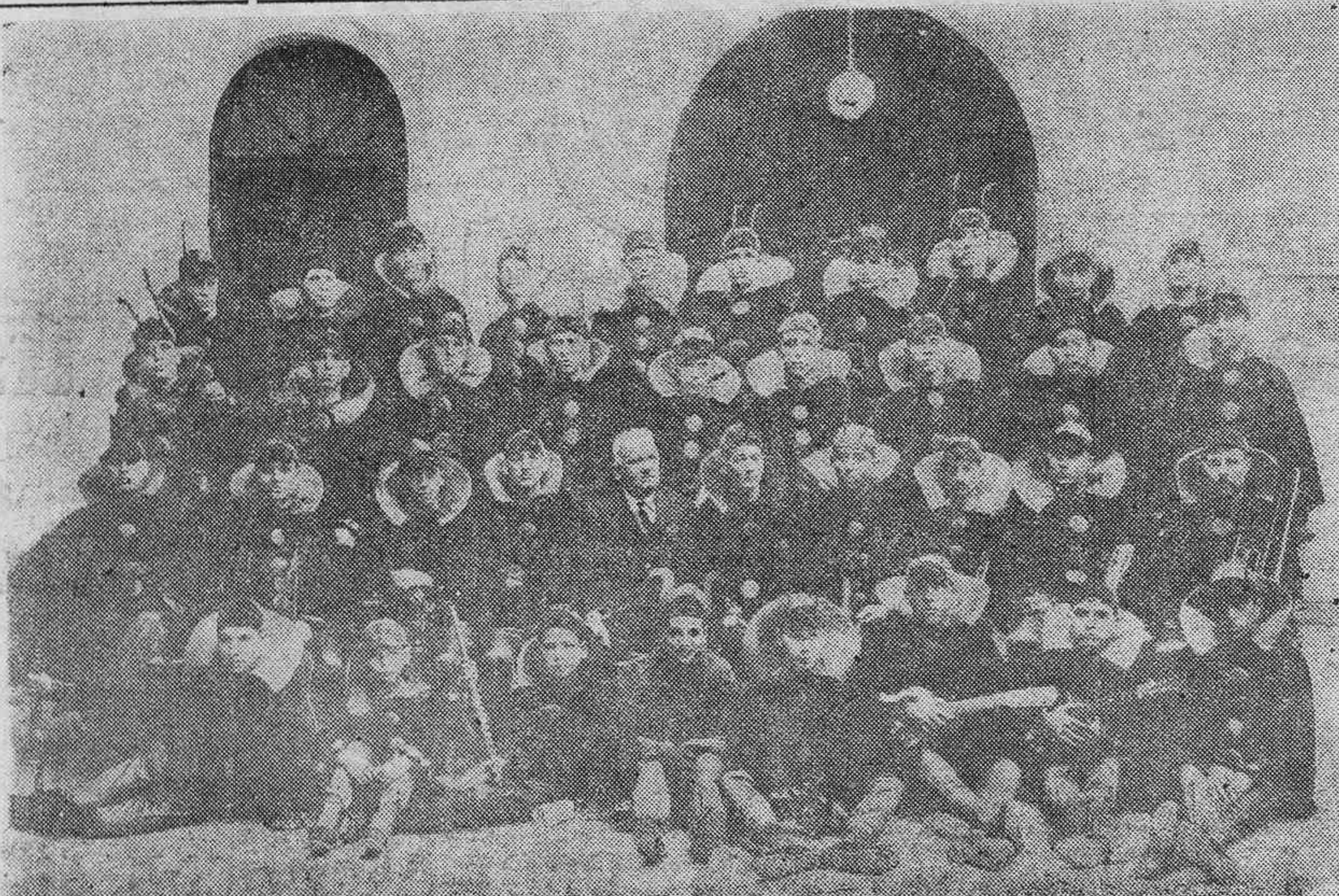
La agrupación del Orfeón "La Paz", de La Laguna, a la que el Jurado concedió un premio de 400 pesetas.

MANCHONES.—Se vende hierba en grandes porciones, para comerla el ganado en el prado y para segar su orilla. El manchón tiene buen piso y bastante soleado. Informar a don Emilio Rivero, en Tegueste.