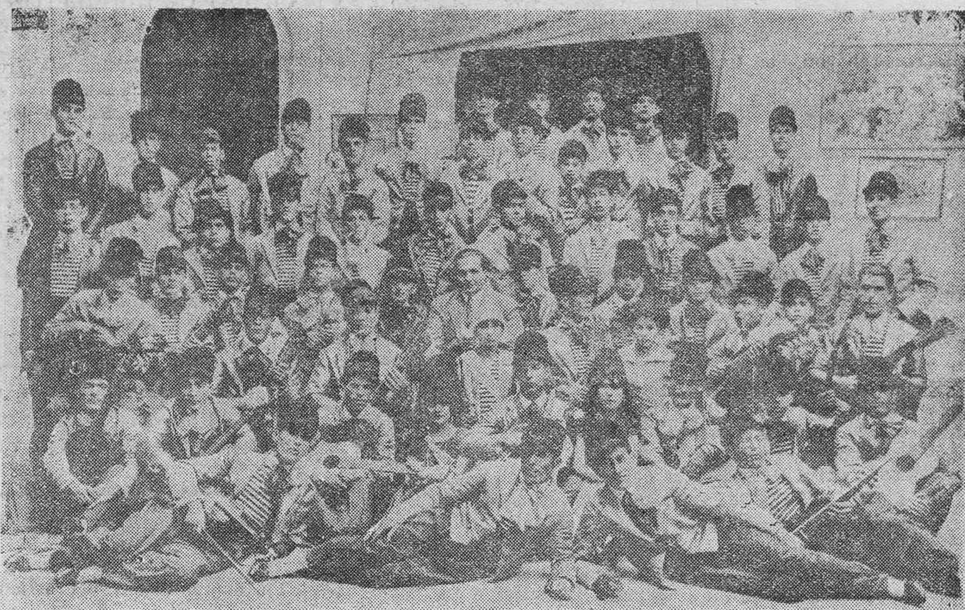
Rondalla de la "Juventud Republicana", que obtuvo el primer premio (500 pesetas) en el concurso celebrado el domingo en la Alameda de la Libertad.