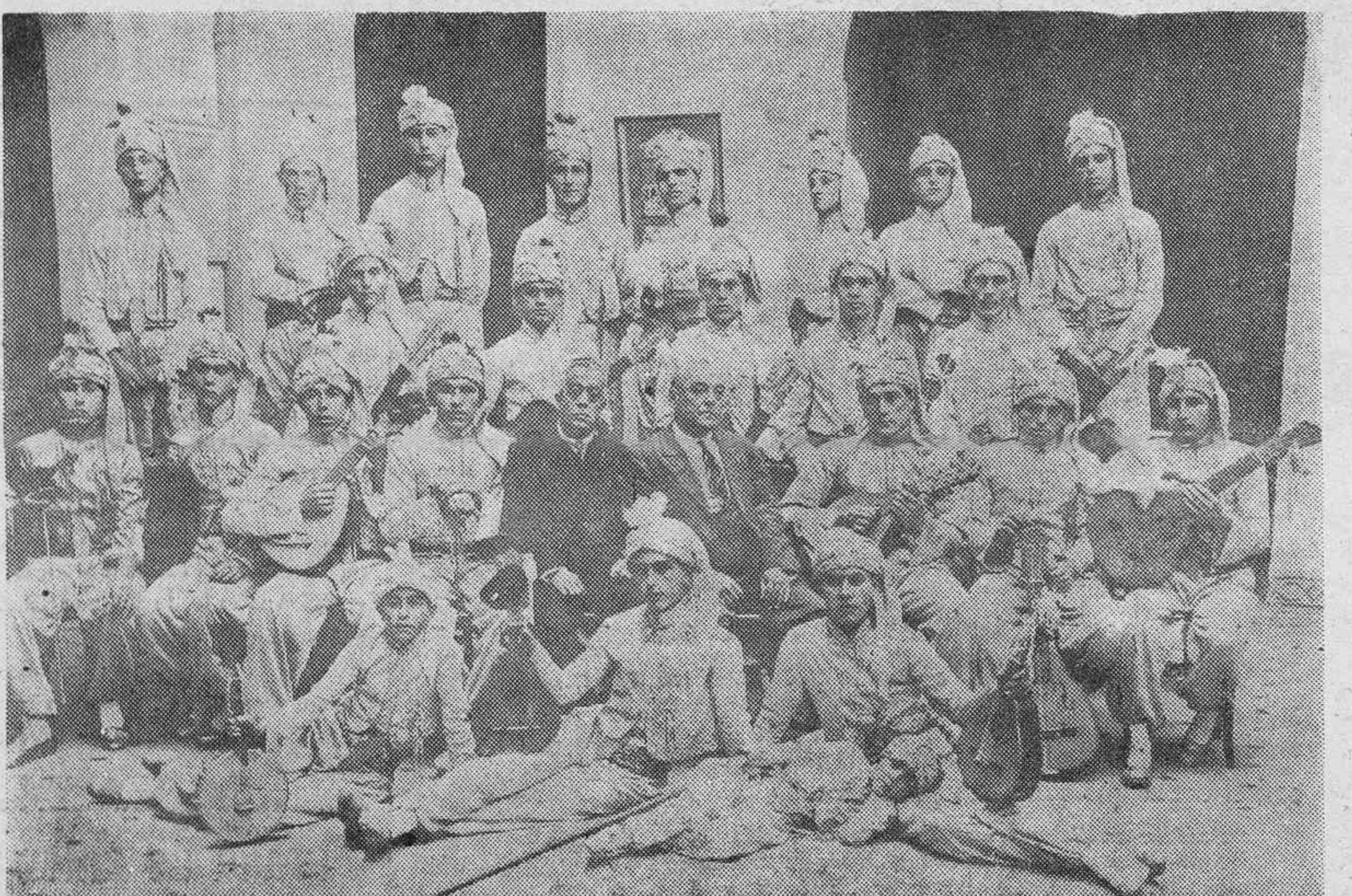
La rondalla de la Sociedad «La Prosperidad», que también fué premiada en el concurso del domingo de Carnaval.