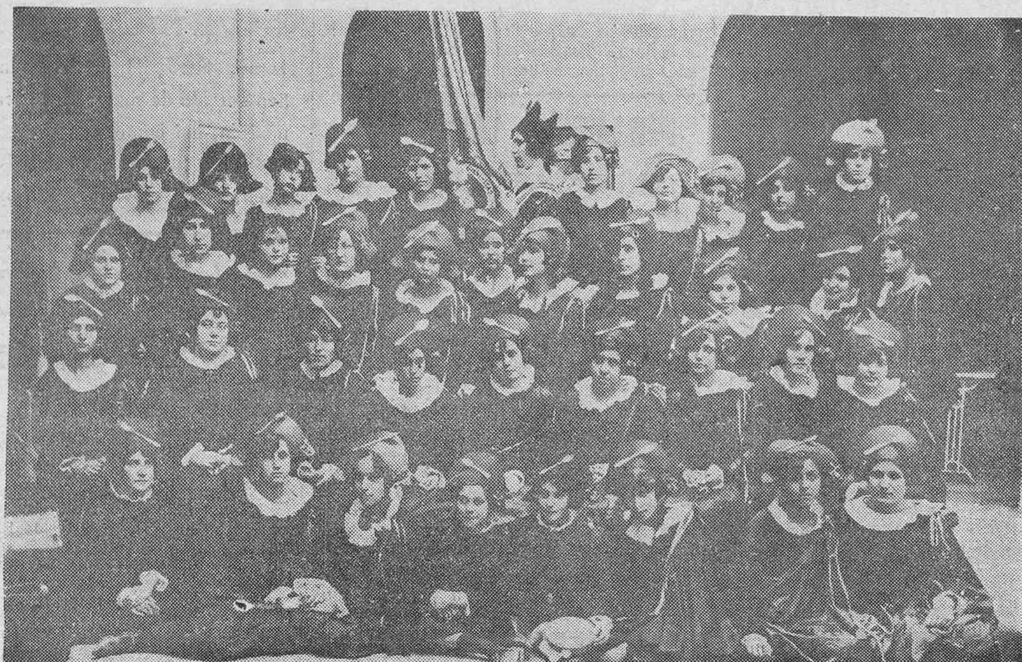
La notable estudiantina de la Normal de Maestras de La Laguna, que obtuvo premio en el concurso del domingo.

SE VENDE por la mitad de su valor y con muy poco uso, una puerta propia para garage, de cuatro hojas, de tres metros de ancho con sus guías, cerraduras, visgras, pasadores, y el piso de todo el ancho de cantería labrada. Infornarán en Imeldo Serís número 108. Teléfono 67.