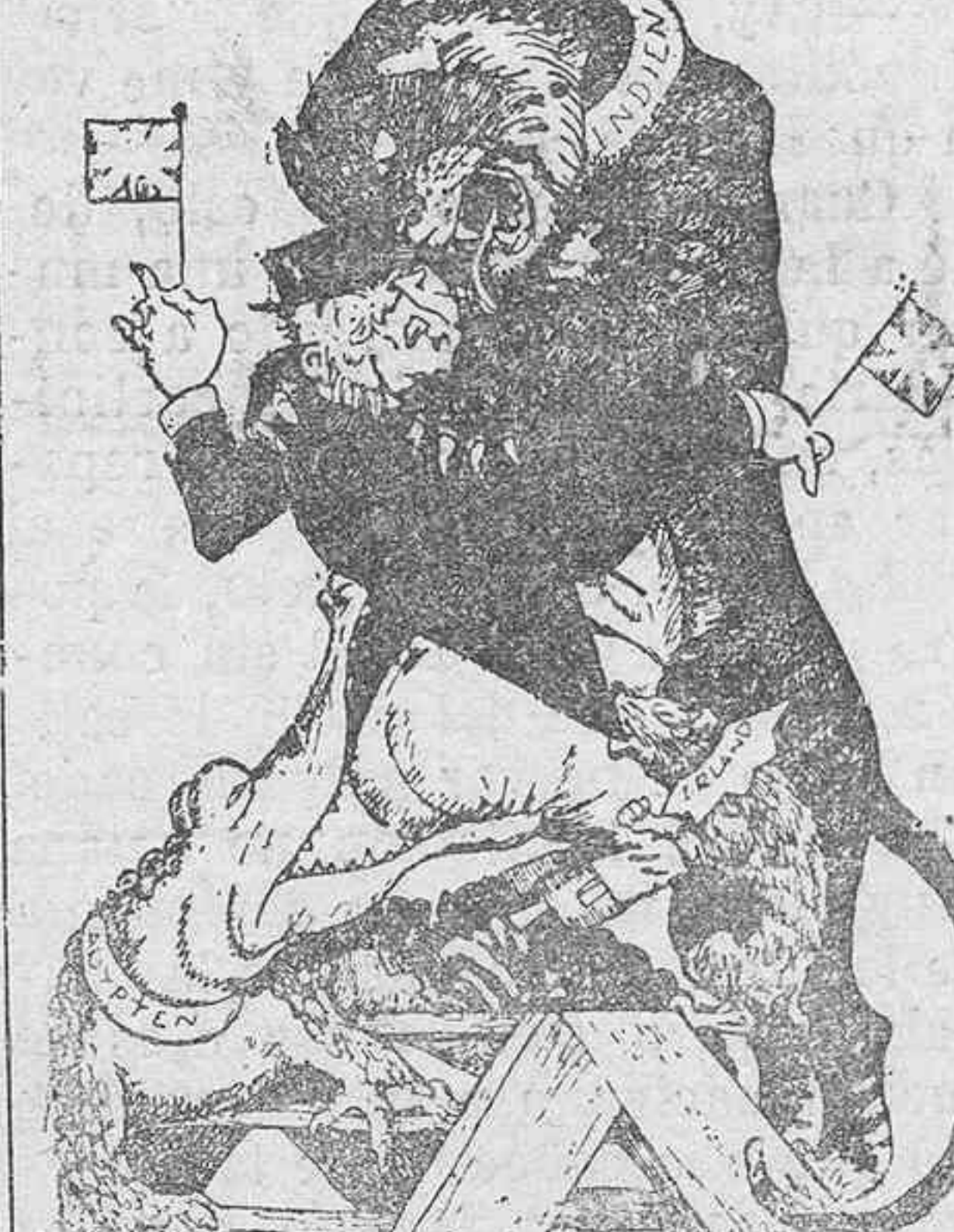
El tigre indio y el domador en peligró. (De «Kladderatsch», Berlin.)