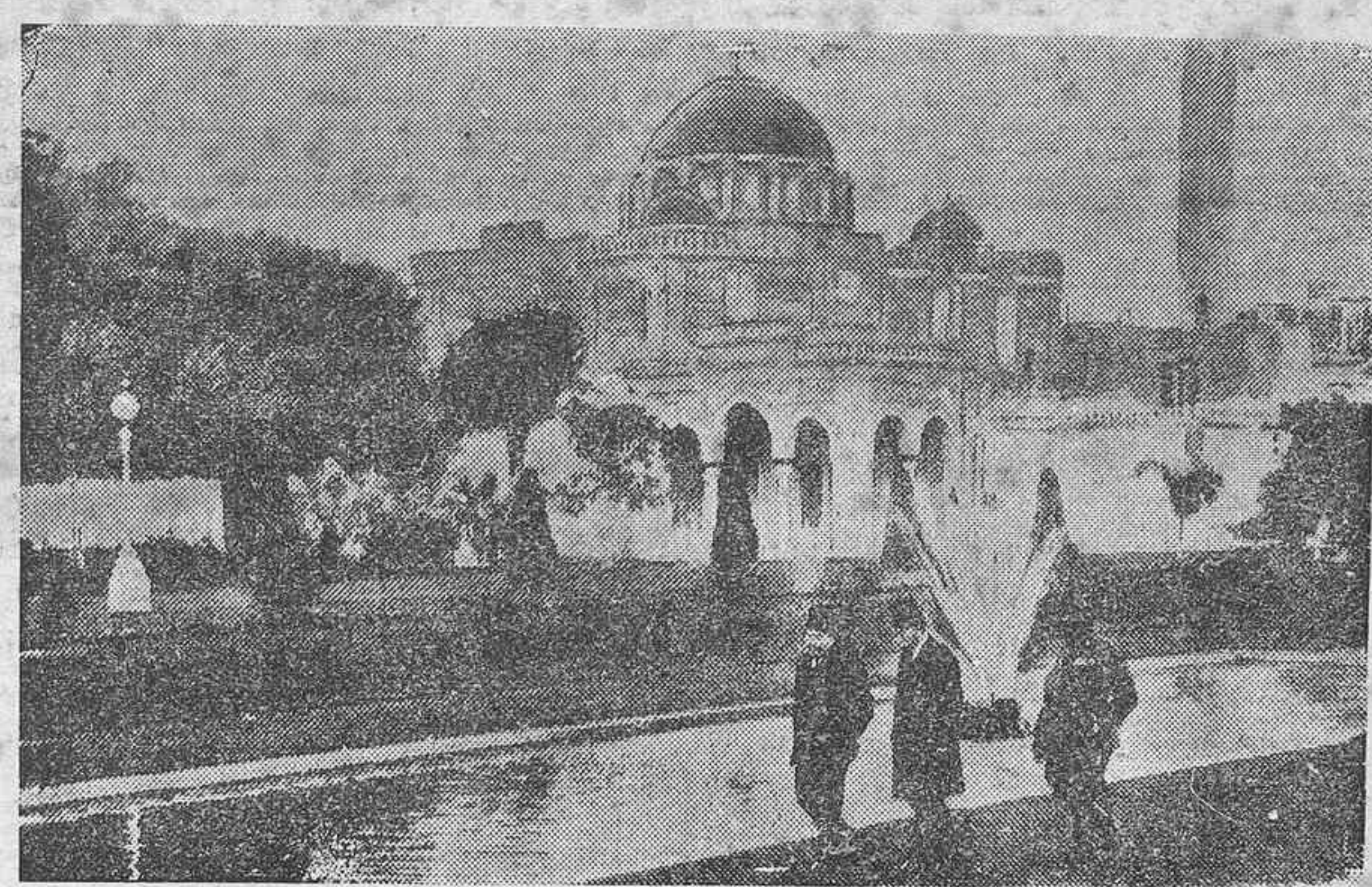
El conflicto surgido últimamente entre Inglaterra y Egipto preocupa la atención del mundo. En la fotografía aparece el Rey de Egipto paseando con Zagloul Pasha en los jardines de palacio.