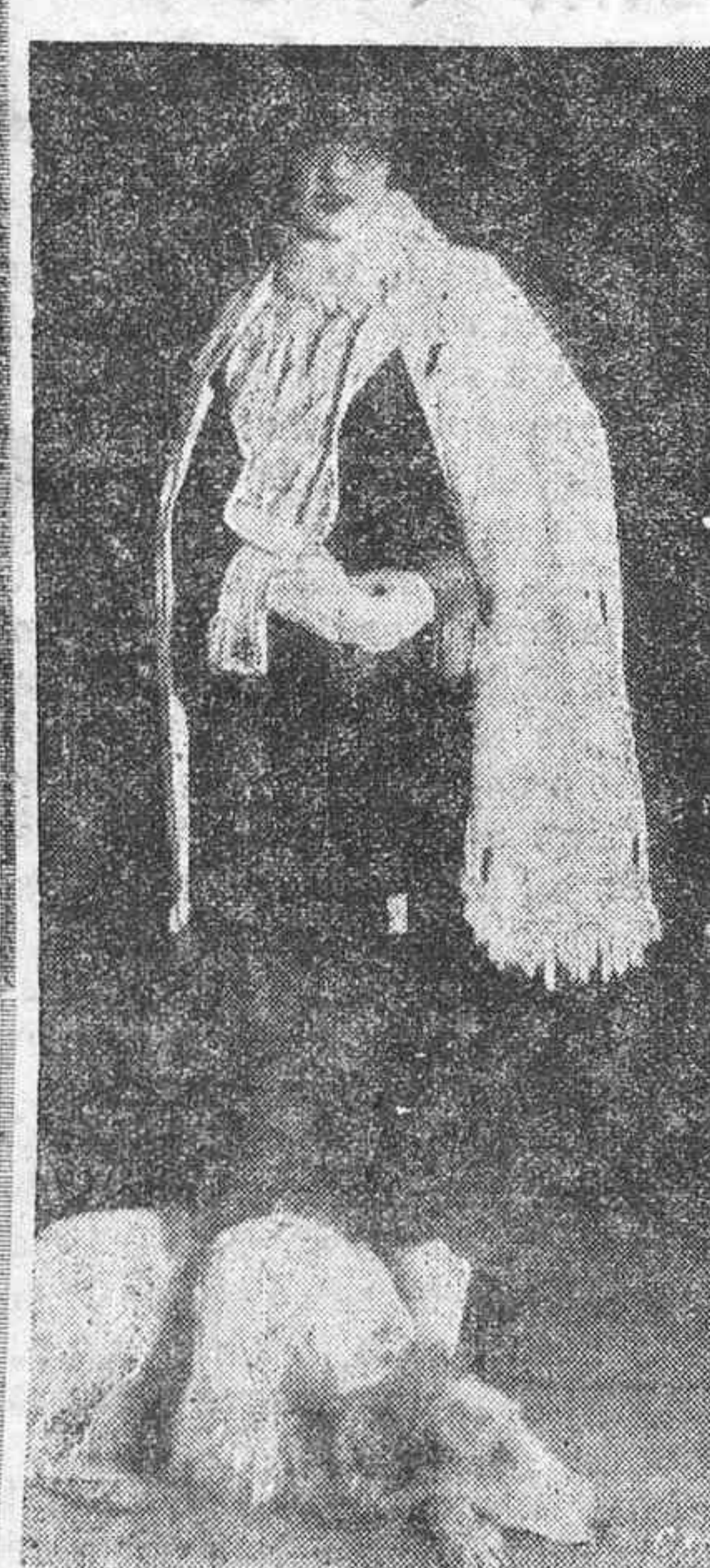
La actriz Marion Davies, luciendo una «toilette» suntuosa

las odorantes y las mujeres se muestran ligeramente provocativas y nos seducen con la inocencia de su mirar intencionado.