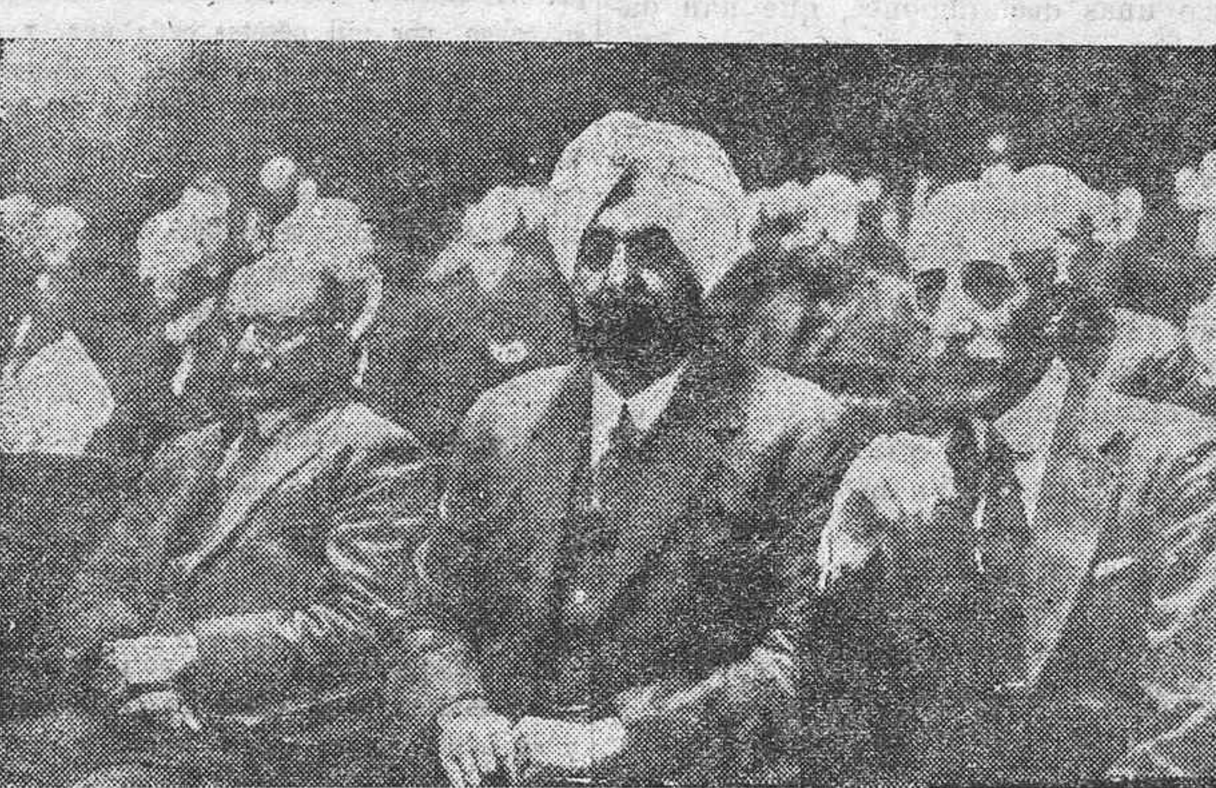
El maharajh de Patiala, considerado como el hombre más rico del mundo

He aquí todo un gran señor, el famoso maharajh de Patiala, considerado como el hombre más rico del mundo, y que en calidad de pacífico congresista figura entre los concurrentes a la Asamblea de Naciones, donde su exótica y gallarda figura ha atraído desde luego la curiosidad de las damas y nuevos ricos. Sobre la opulencia del maharajh se ha escrito profusión de artículos en toda la prensa de Europa con motivo de su reciente estancia en Londres, donde ha hecho una vida de fastuosidad y dispendio por nada superada hasta ahora. En efecto, según refieren las crónicas del gran mundo, el maharajh de Patiala y su colección de esposas y servidores ocupaban treinta y cinco departamentos, con un total de cien habitaciones, en uno de los hoteles más caros de la capital británica. Se calcula que sus gastos diarios ascendían a cuatro mil libras, y como prueba de su extraordinaria munificencia, el maharajh ofreció a los príncipes y grandes aristócratas ingleses regalos que suponían un valor de algunos cientos de millones.