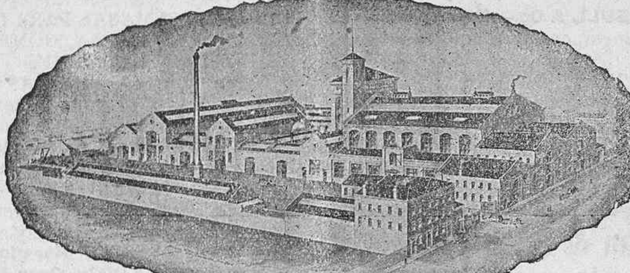
La fábrica Burell a Millwall, Londres

La mejor pintura para el hierro al descubierto, cuyo uso se ha generalizado rápidamente; emplándose en toda clase de obras expuestas a la intemperie, tales como puentes, techos, columnas, etc., por ser un moderno preparado, anticorrosivo, resistente a altas temperaturas, económico, ya que una sola aplicación protege el hierro por largo tiempo, y durable, aún en los países de clima más cálido. SE VENDE EN DISTINTOS COLORES FABRICACION EXCLUSIVA DE BURELL & CO. LTD., LONDRES.