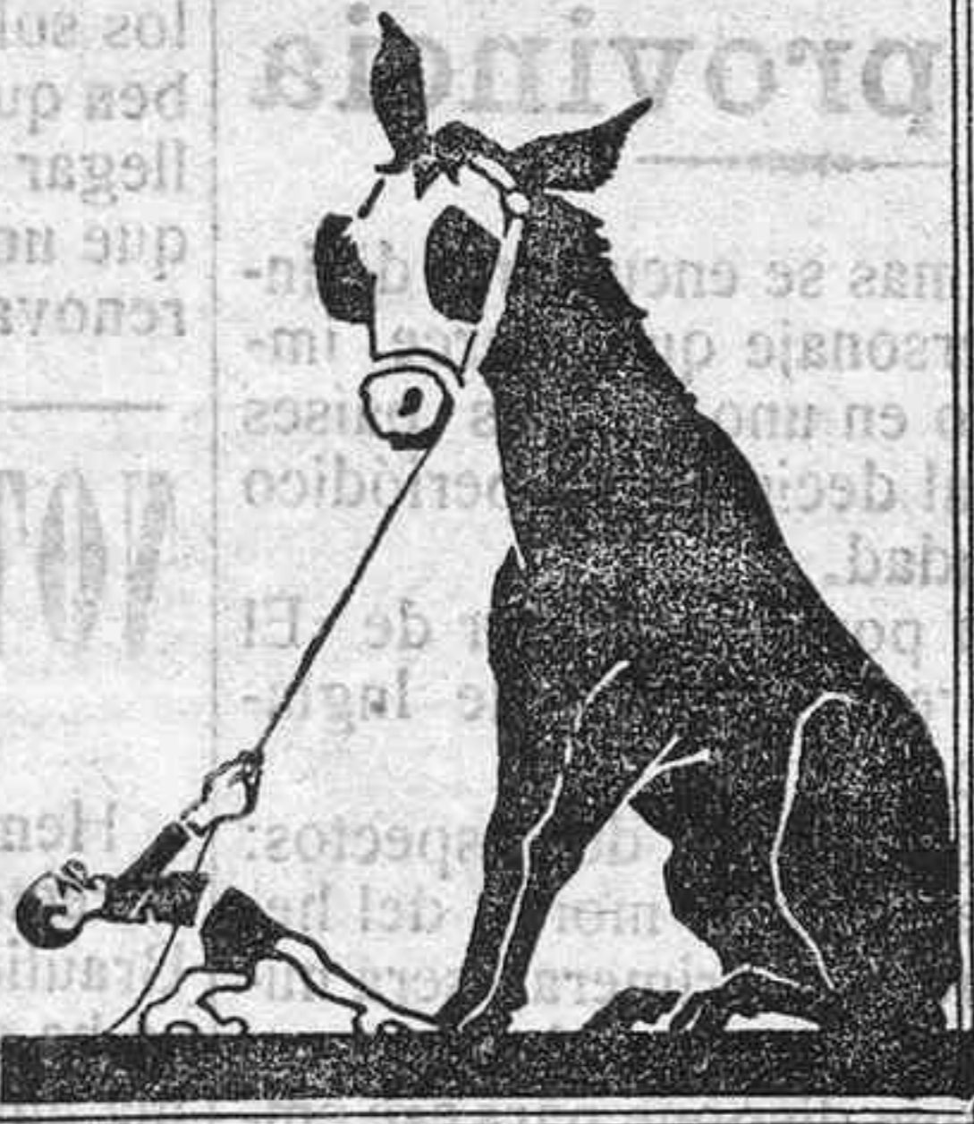
Práctico en su próximo día de lavado.

obstinadamente se niegan á usar ningún otro. Estas señoras con el Sunlight Jabón como auxiliar suyo, pueden afrontar la llegada del día de lavado sin miedo alguno, porque están seguras de una rápida expulsión de toda la suciedad.