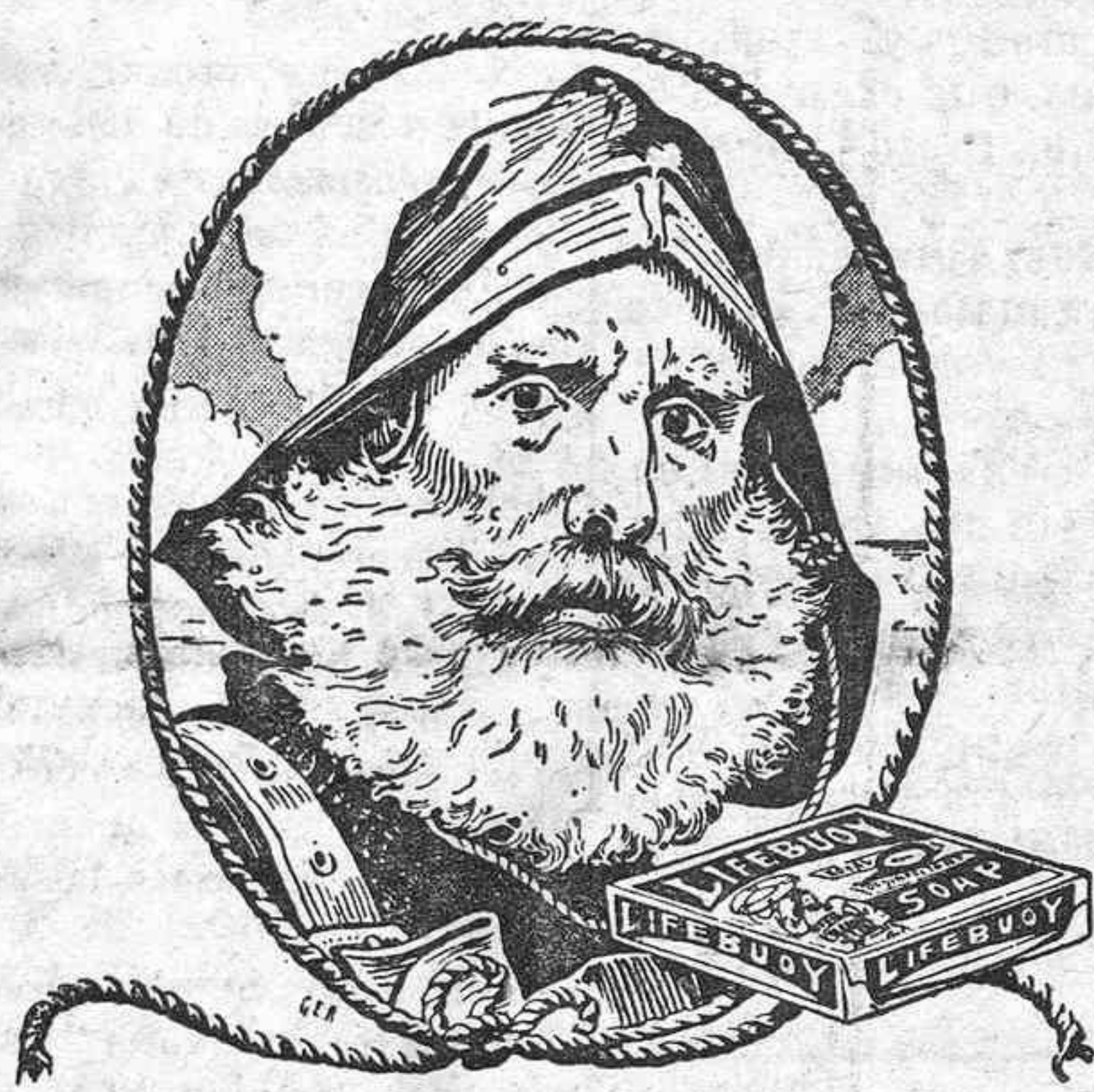
UN PRESERVADOR DE LA VIDA!