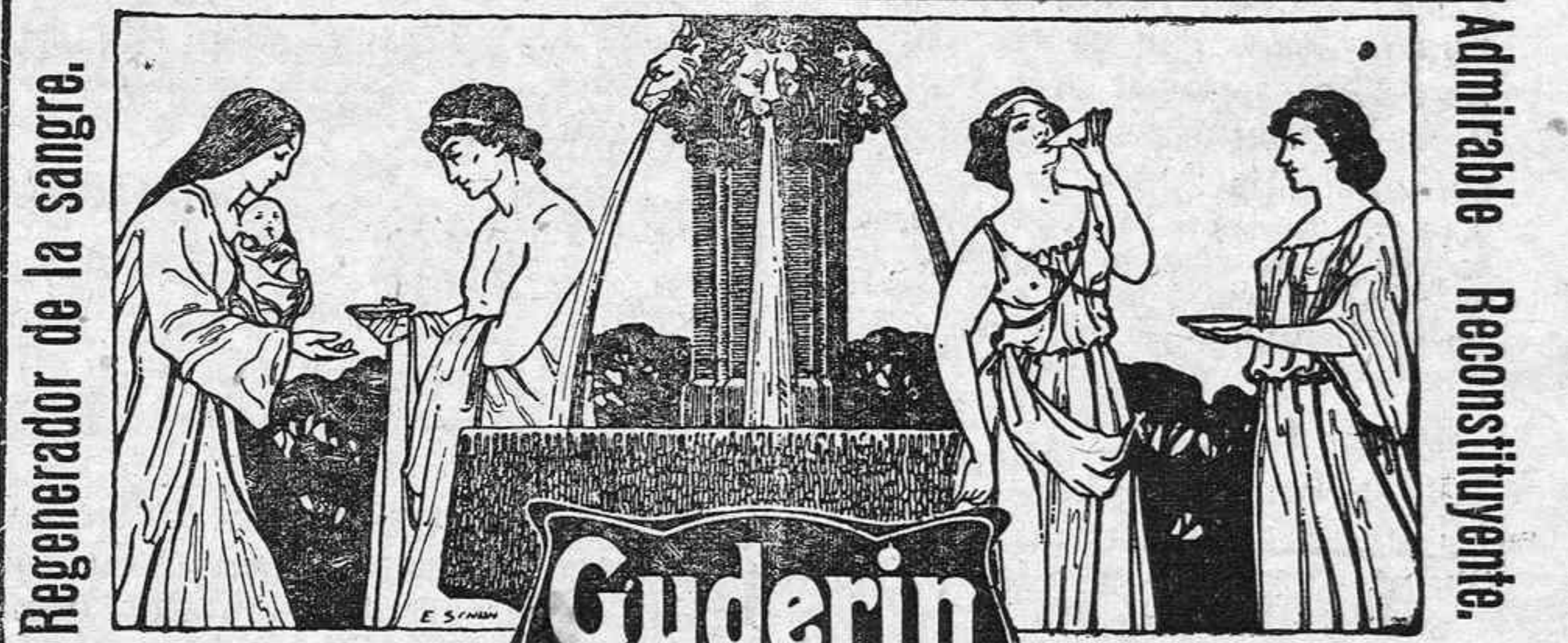
Admirable Reconstituyente. Regenerador de la sangre.

También se venden patatas. Todo fresco, barato y sabroso. No olvidarse, Imeldo Serís 97. (Trasera del Banco de España).