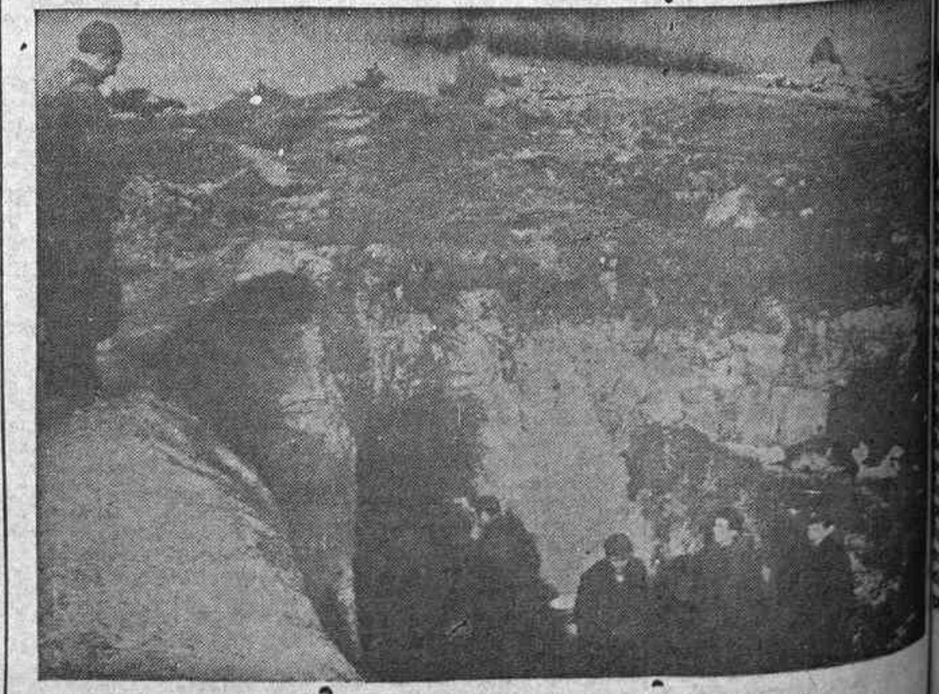
Otro reducto enemigo que cayó en poder de nuestras fuerzas