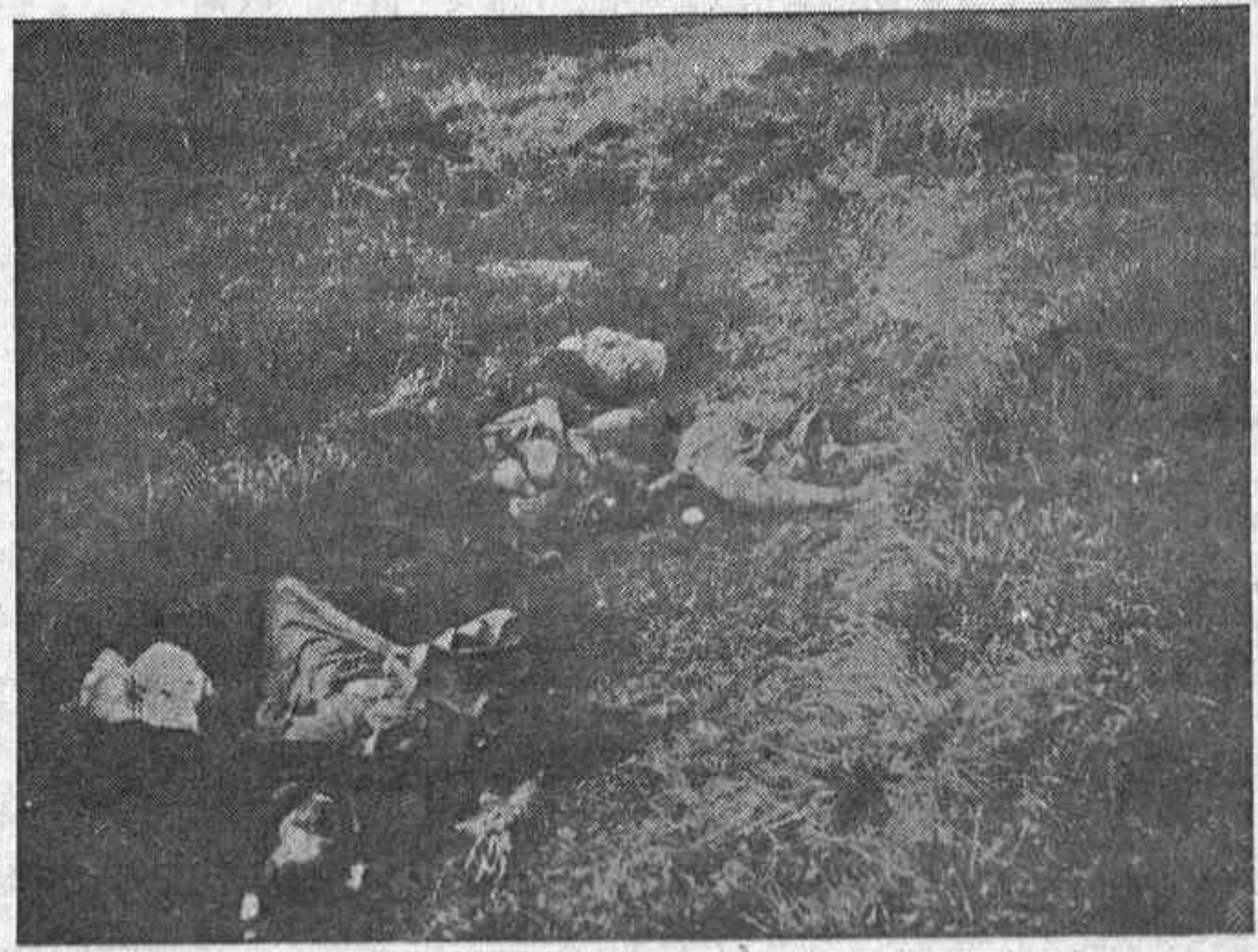
Cadáveres de moros El que apa rece en primer término se halla partido en dos por un cañonazo

su madre y su tía que son las que hoy cuentan esta historia trágica. En cuanto al viejo no saben decir lo que pasó. Sólo que al día siguiente del asesinato del mozo lo encontraron muerta junto al cierre de la huerta, con un balazo en la cabeza y espantosas cicatrices en toda la cara.