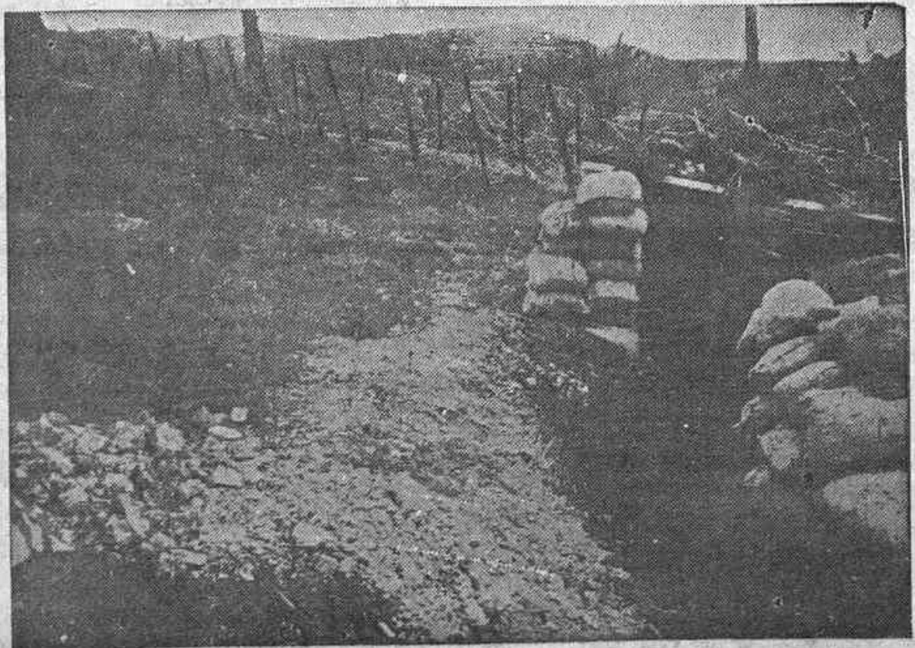
Una de las trincheras ocupadas al enemigo en Buenavista