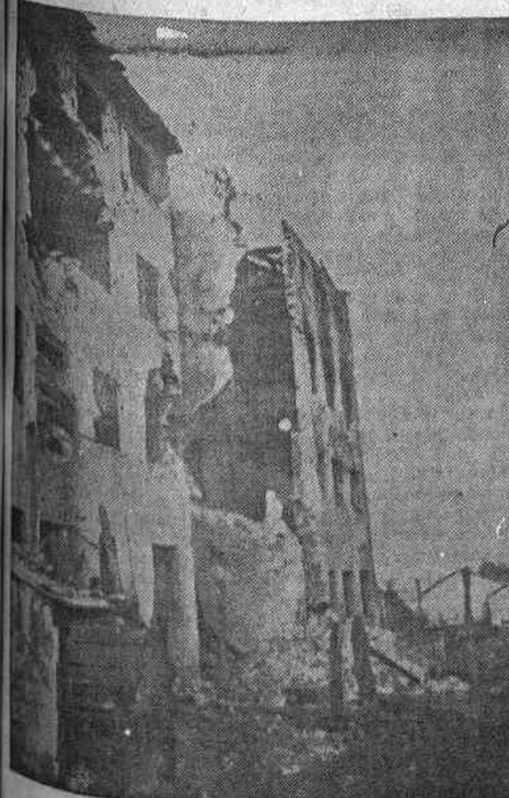
La famosa casa del Jabonero

La obsesión de la artillería La artillería leal es una obsesión para todos los soldados facciosos, que han salido muy castigados por los certeros obuses de nuestros cañones, y es cuan-