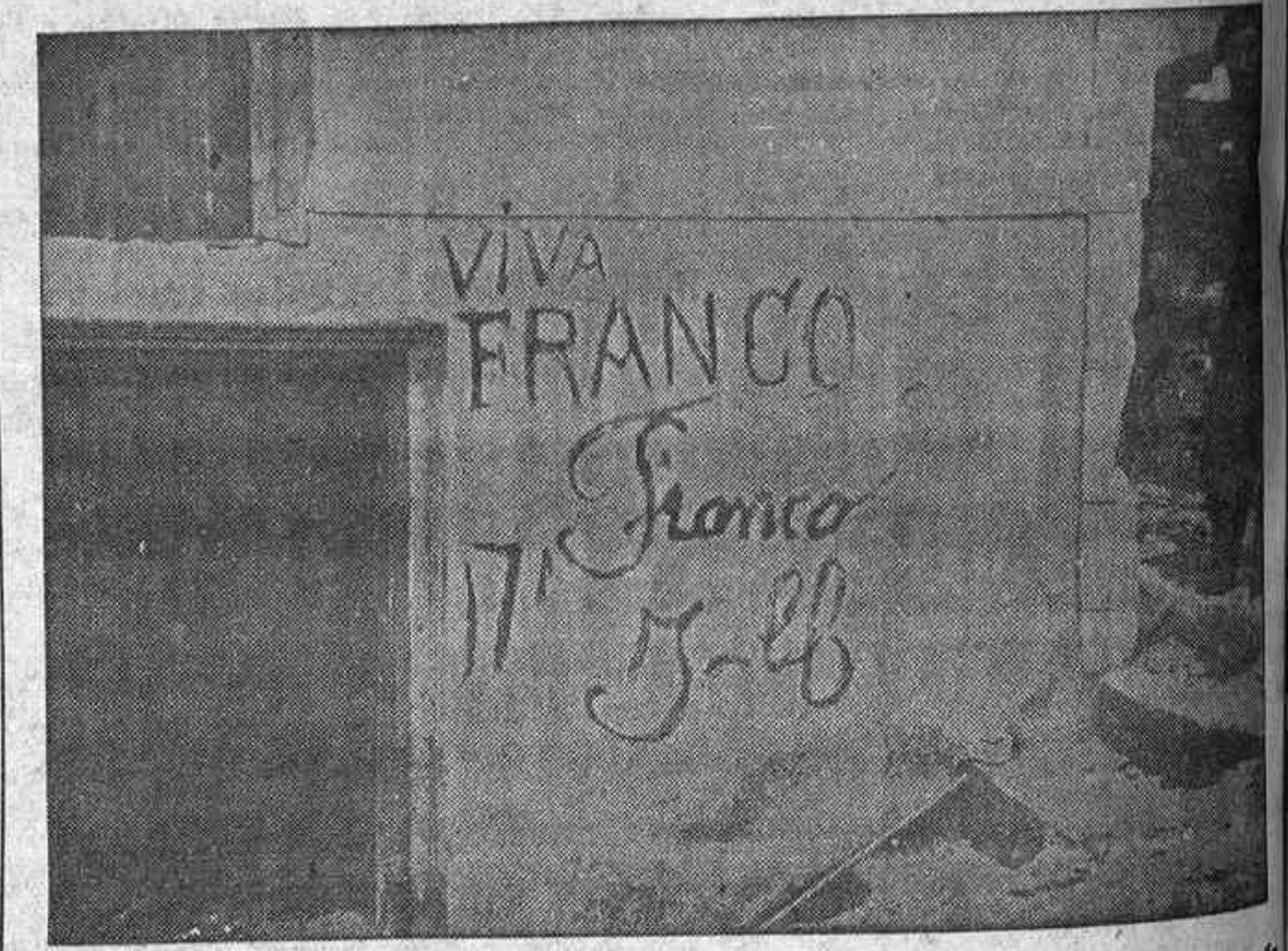
En una casa de Buenavista, recientemente ocupada, vemos esta inscripción: ¡Para qué queréis los borregos de Galicia que viva Franco?