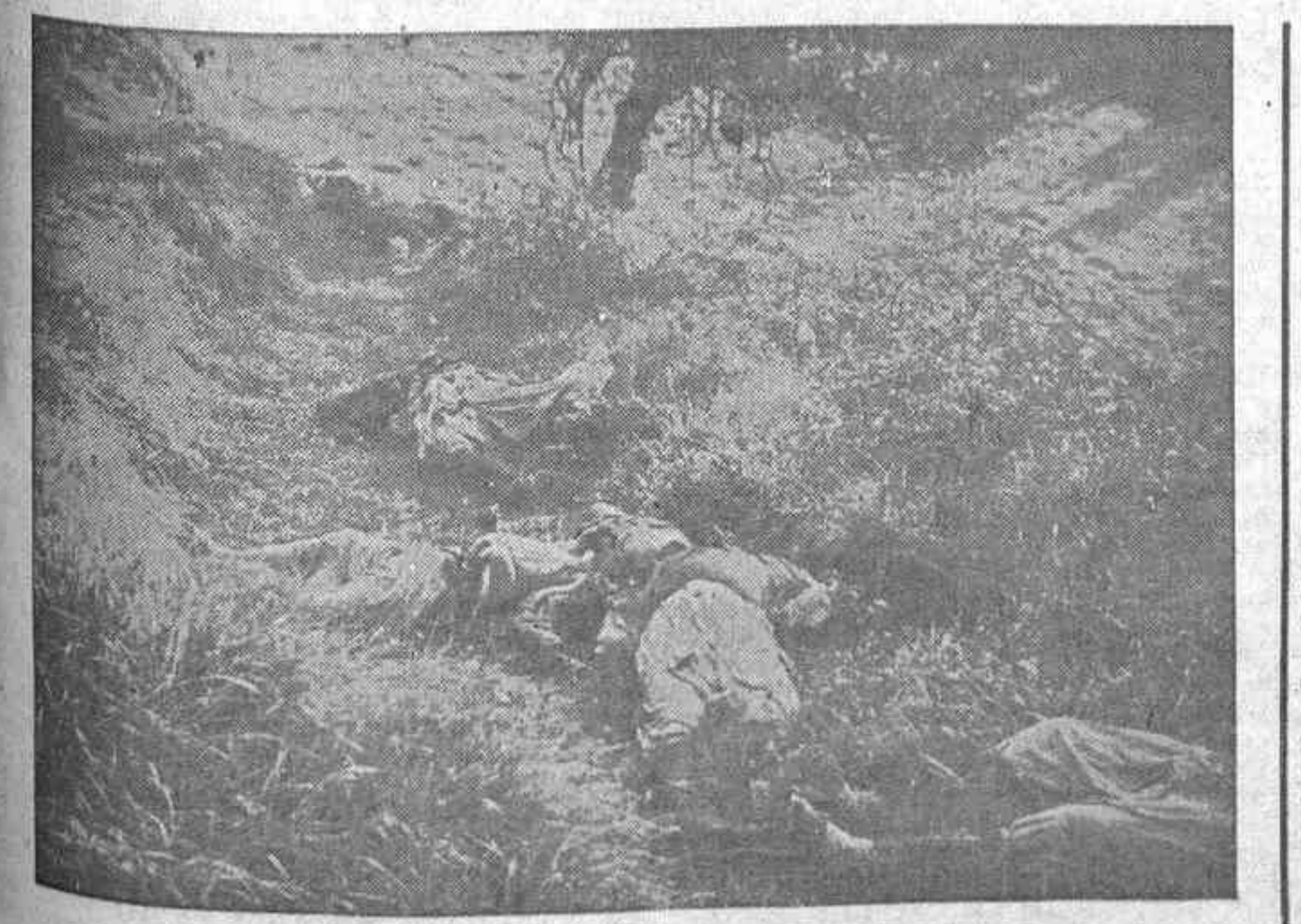
Cadáveres de moros en el campo de batalla

que al hacerlo prestan un gran servicio a la causa revolucionaria y además laboran por la aspiración de toda tu vida; como es tu LIBERACION. Por las Organizaciones de Petróleo: CNT-Consello Obrero de Petróleo U G Ty de Asturias y León.