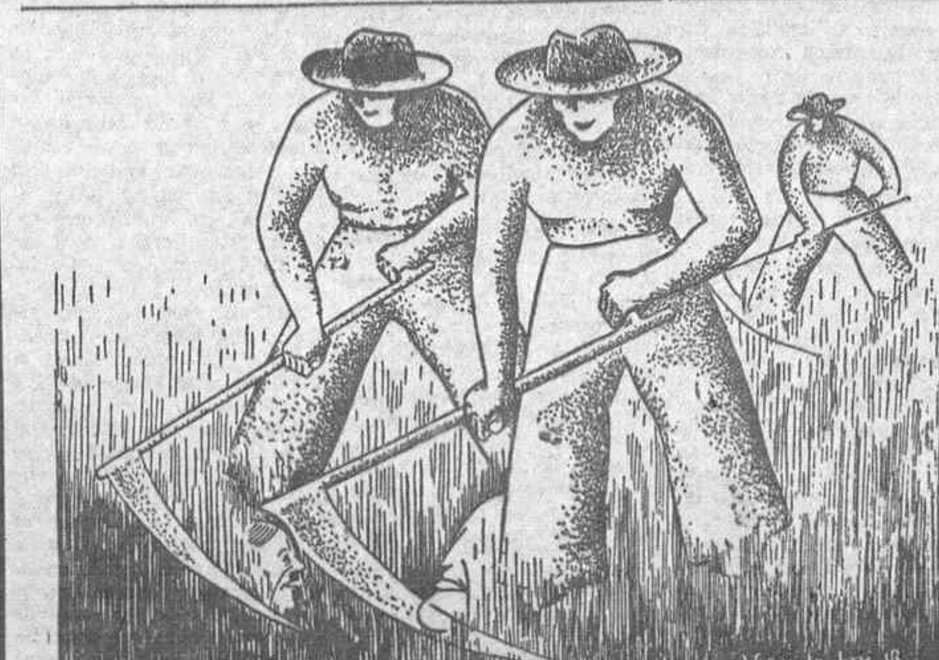
LA MALA HIERBA