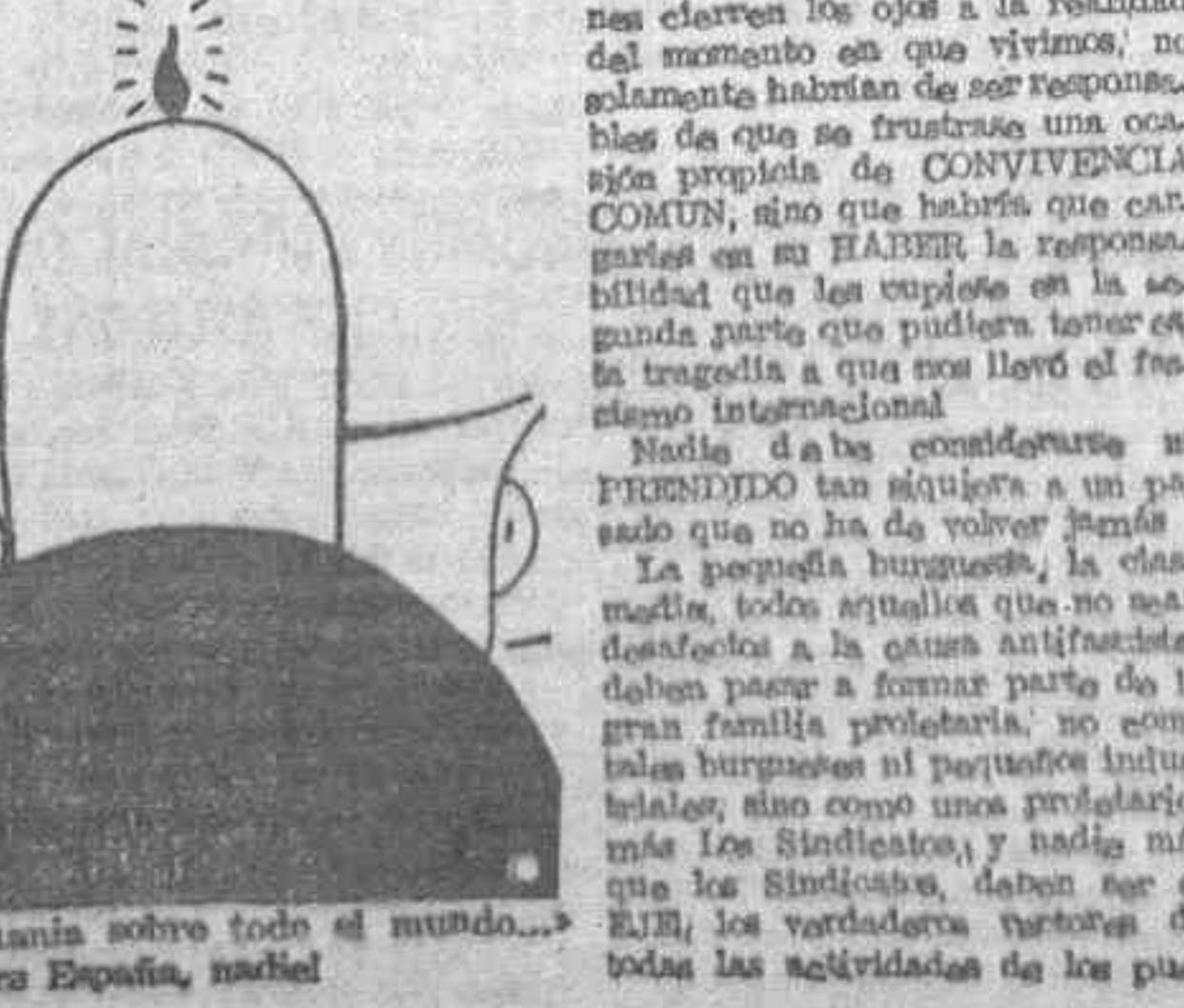
EL CORO FASCISTA: «Aie manía sobre todo el mundo...» EL PUEBLO ESPAÑOL: «¡Oh España, madre!»