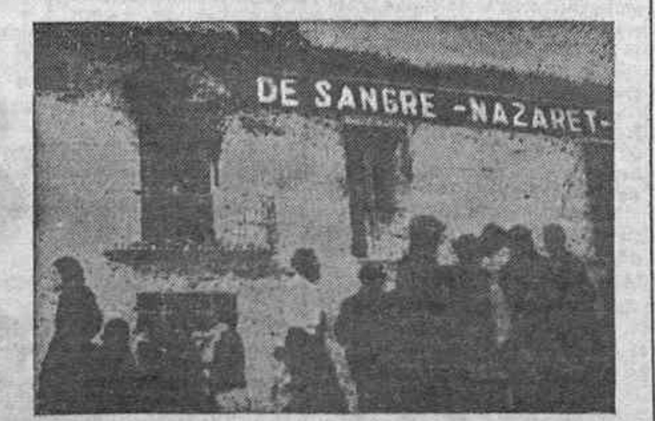
Y DICE HITLER QUE NO QUIERE SANGRE! He aquí un hospital de Valencia bombardeado brutalmente por los moros rubios de sus «Junteros».

VARSOVIA, 31.—En la Universidad se han registrado nuevos choques entre estudiantes nacionalistas y judíos, resultando heridos dos de estos últimos. La policía ha practicado detenciones en ambos bandos.