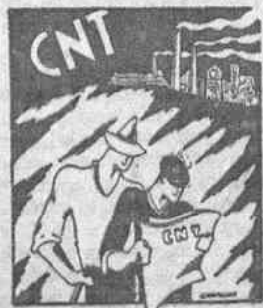
Organo de la Regional Asturiana.

Para los trabajadores organizados en la Confederación; para los compañeros anarquistas, no debe haber más que un periódico: