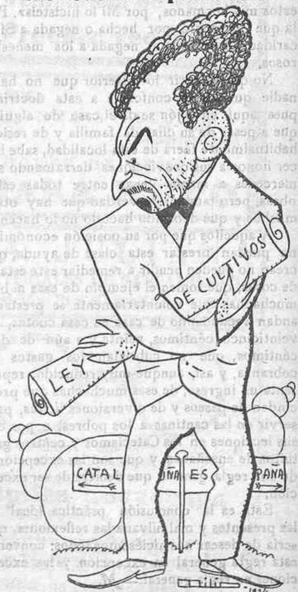
Buen lector, aquí bien ves se sostienen en dos pies.