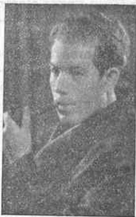
Don Juan del Cura, entusiasta y elocuente propagandista social-católico