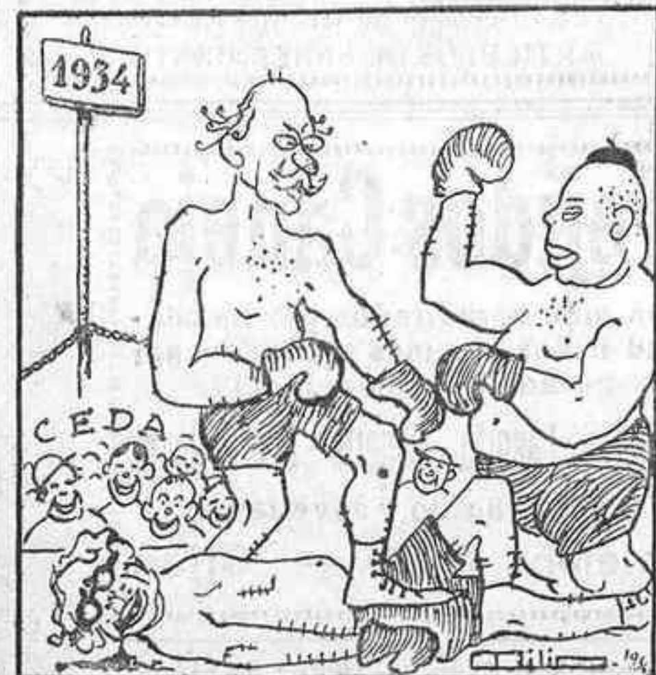
Mas ahora, ¡oh, dicha! cortas!, ya se reparten las «tortas».

Y la «C. E. D. A.», espectadora, los contempla en esta hora exclamando como aquellos: «que se pacifiquen ellos».