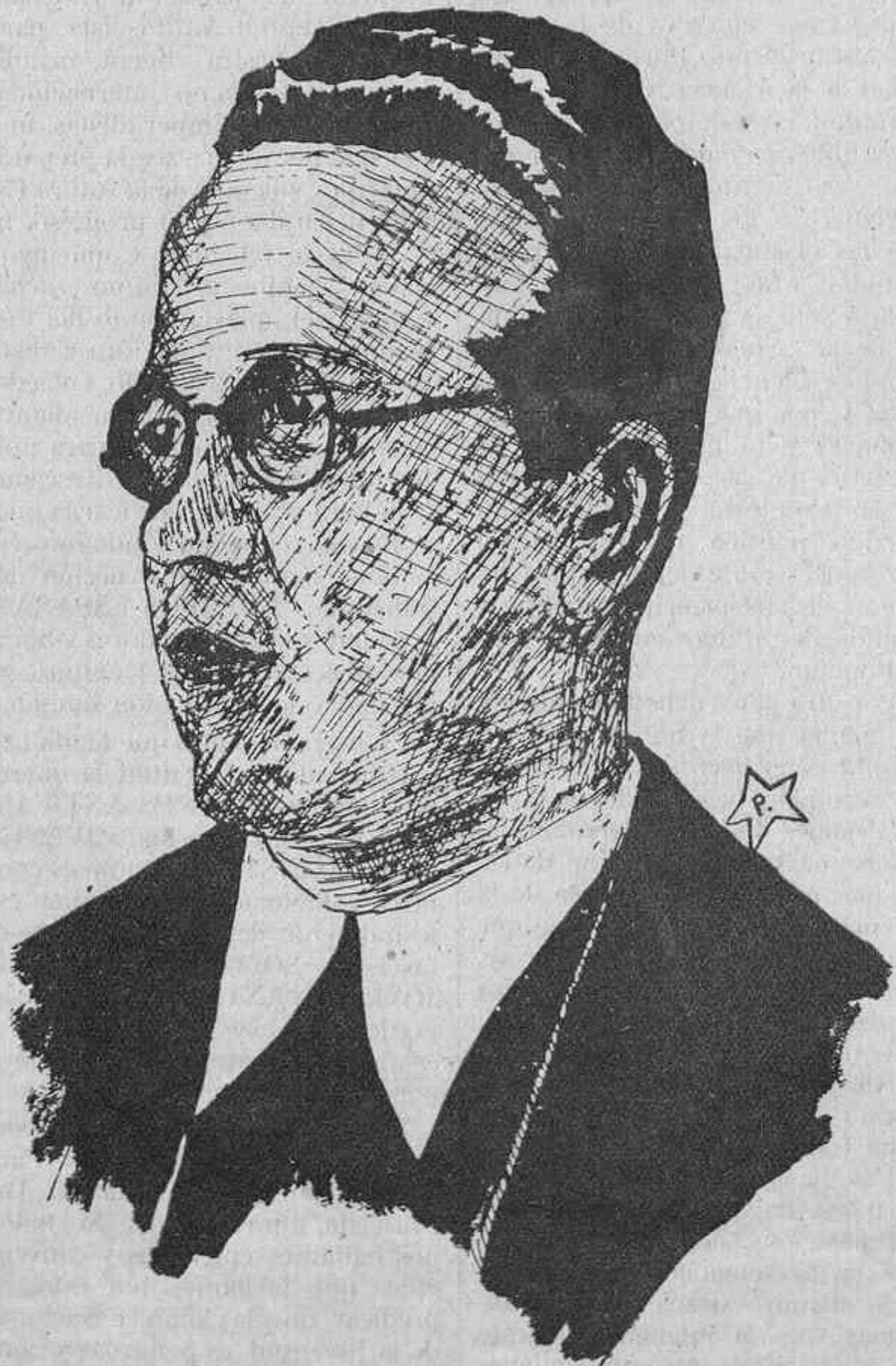
El camarada Santiago Carrillo, dirigente de la juventud española, que en la reunión del Comité Nacional de nuestra organización expone a éste la justeza de nuestro ingreso en la I. J. S. para luchar por la unidad internacional.

Los que están en contra de la República no deben de olvidar que Franco combate en contra de ella.