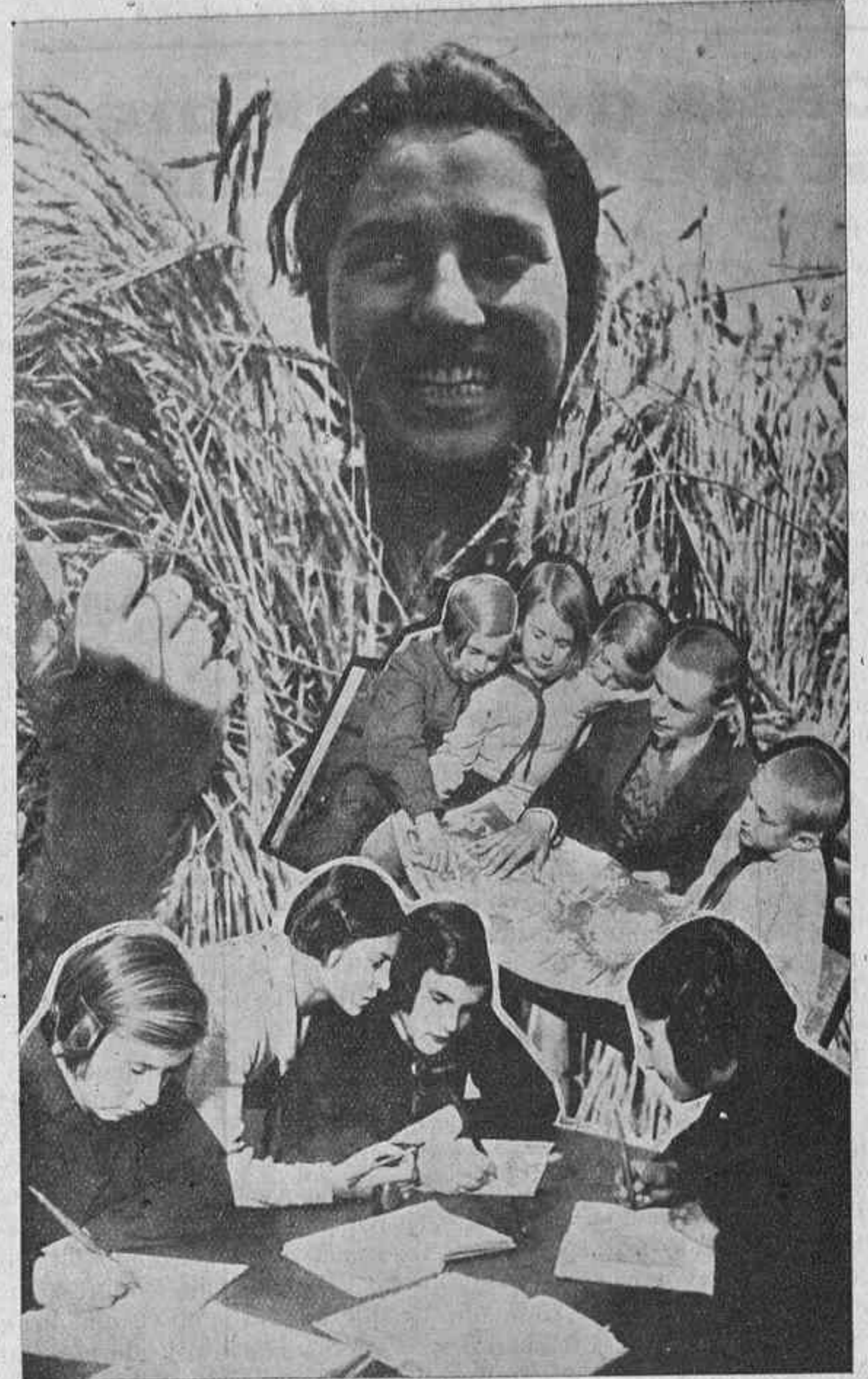
LOS GRUPOS ALERTA PUEDEN TRABAJAR Y SER ÚTILES:

Agradecemos su cordial ofrecimiento y le deseamos una buena actuación en su puesto para bien de la justicia antifascista.