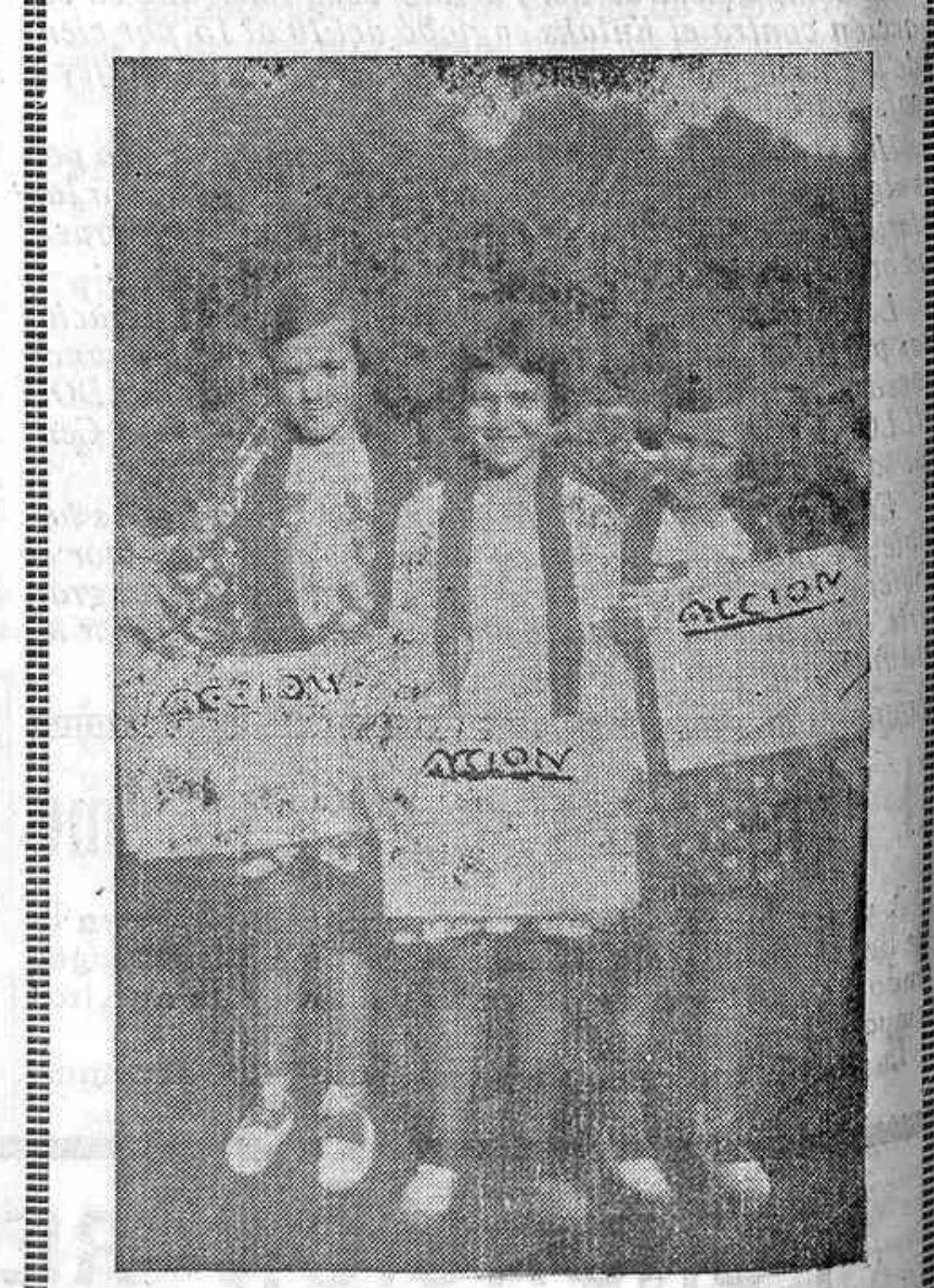
Vendedoras de ACCIÓN en Perlera.