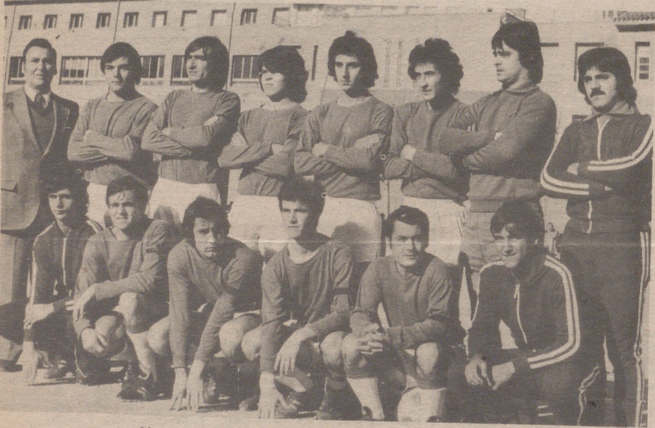
Mequenza, Trofeo deportividad Primera Regional.