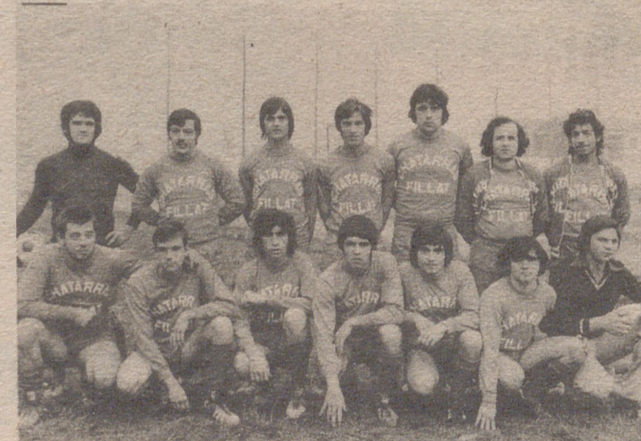
San Gregorio (Tercera Regional)