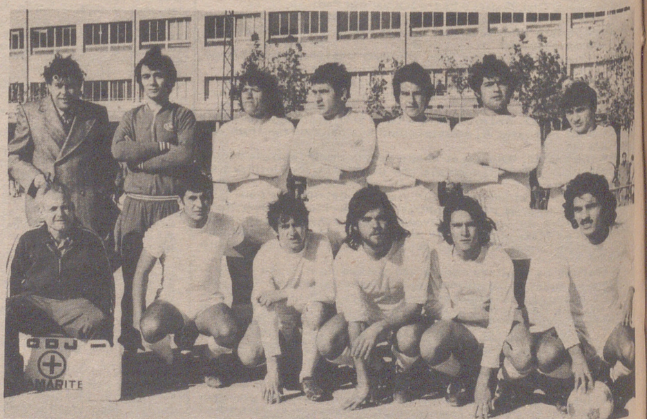
Tamarite 76-77. Equipo máximo goleador de Primera Regional.