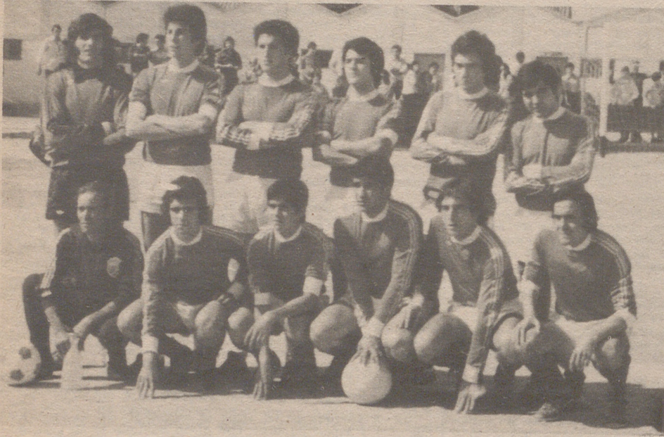
C.D. Caspe. Equipo más deportivo, Primera Preferente.