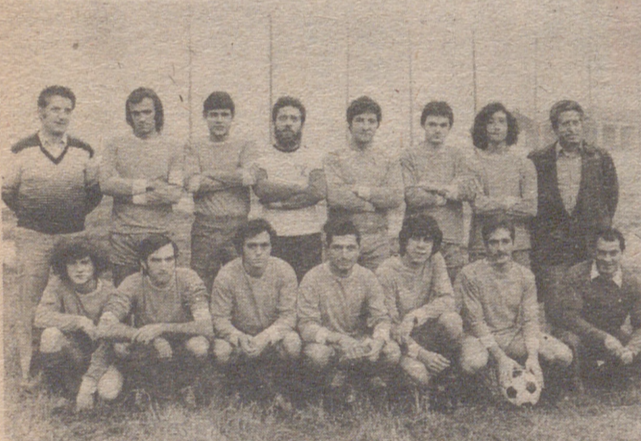
Hogar Navarro (Tercera Regional)