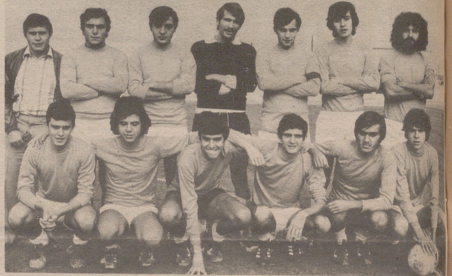
Pegaso, Tercera Regional