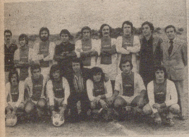
Ajax de Jusibol. (Segunda Regional)

C. D. AJAX DE JUXLIBOL, 1; INDEPENDIENTE C. F., 7