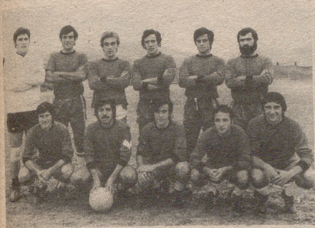
Independiente (Segunda Regional)