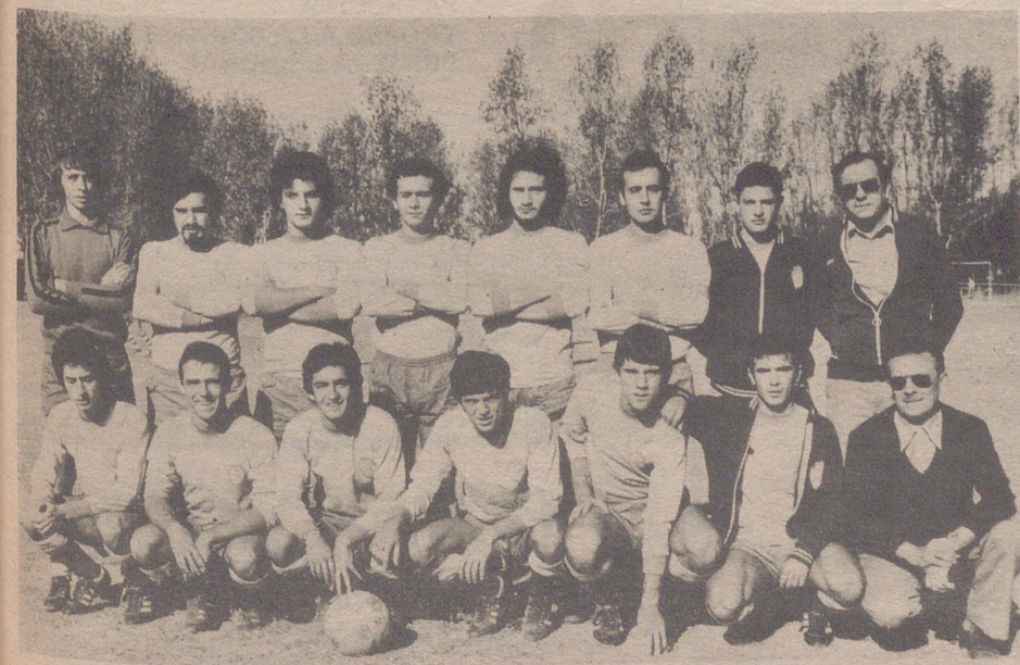
Calasanz, Segunda Regional.