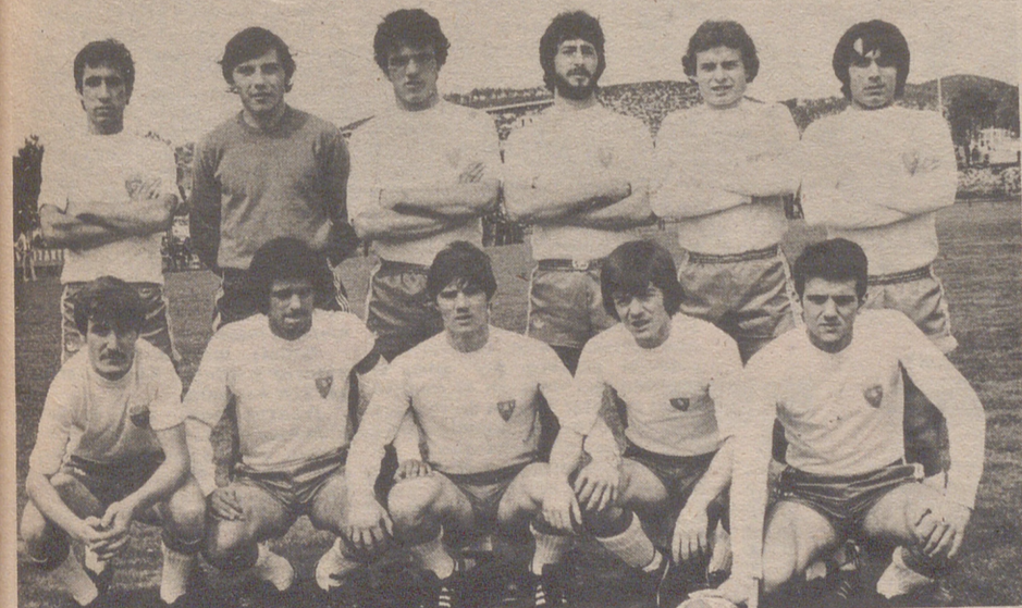
Equipo del Real Zaragoza juvenil, revelación del año.