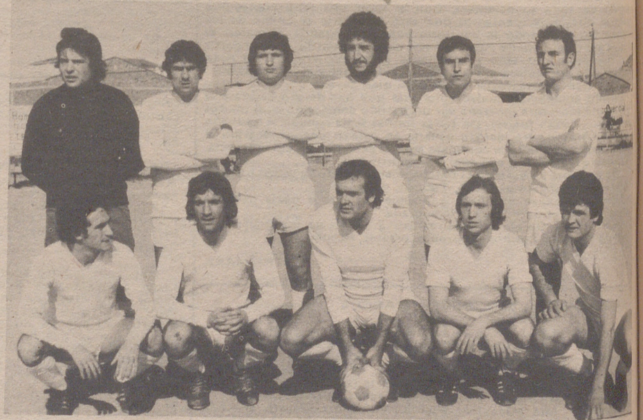
Endesa, Equipo máximo goleador de Primera Preferente