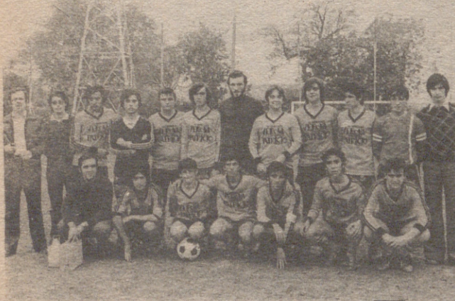
Santo Domingo (Primera Juvenil)