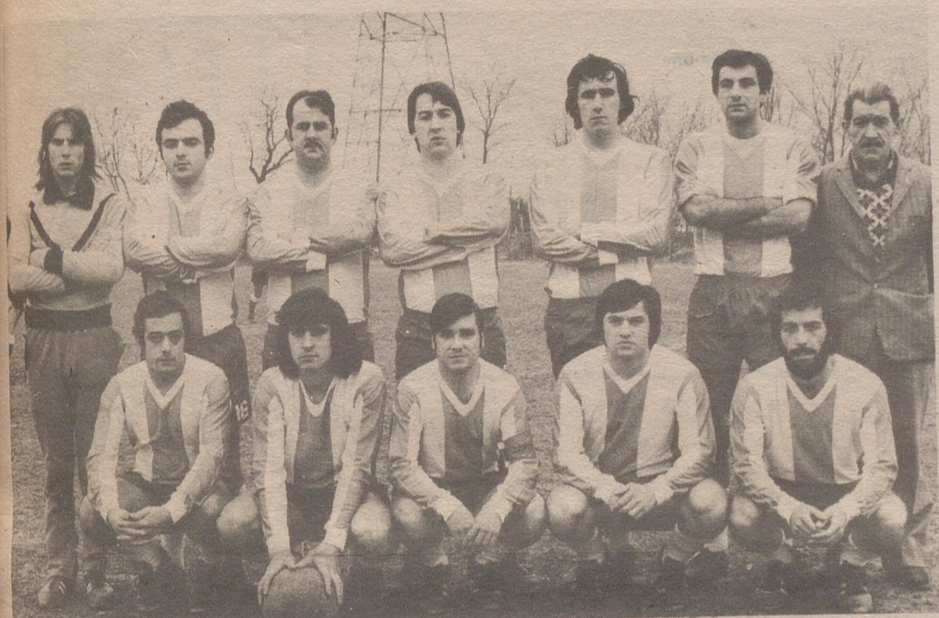
Optica Jena, equipo máximo goleador todas categorías.