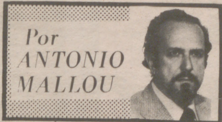
Por ANTONIO MALLOU

A BRIR una buena escuela de educación —era para Jourdan— algo equivalente a cerrar una prisión para muchos años. Educar, desde luego, que no «domesticar», como hacen y hacían, muchas veces, en algunos centros docentes... para desgracia de tantos alumnos.