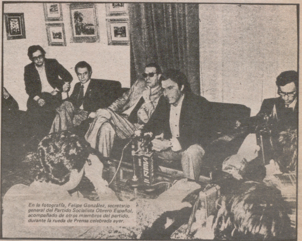
En la fotografía, Felipe González, secretario general del Partido Socialista Obrero Español, acompañado de otros miembros del partido, durante la rueda de Prensa celebrada ayer.

P. INDEPENDENCIA, 19-Tel. 229360-ZARAGOZA