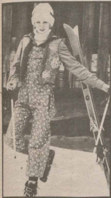
Conjunto de chaleco y pantalón con peto en popelín impermeabilizado y acolchado puro algodón, con estampado de flores blancas y azules sobre fondo azul mas intenso. Modelo KENZO para Hauser Sport, Francia.