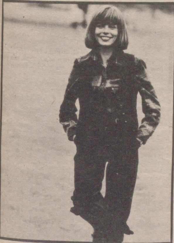
Conjunto muy deportivo en pana de puro algodón. En el pantalón, faja-cinturón de cierre asimétrico. Botones forrados de piel para el chaleco, que se lleva sobre una blusa de gruesa franela de algodón a cuadros multicolores. Creación Lurz Teutloff, R.F. Alemana.

SIEMPRE el frío y su llegada nos sorprende. No debiera ser así, pero... amigas lectoras, ¿verdad que siempre ocurre así...? El frío se nos dice que es una impresión subjetiva, relativa. En el mismo sitio y a la misma hora hay quien tiene frío y hay quien... no lo tiene en absoluto. Y es el caso que unas y otras dicen la verdad. El secreto es - ni más ni menos - saberse abrigar convenientemente y de esa forma las cuestiones personales y de relatividad nos resultarán indiferentes. Una persona abrigada puede - si así lo quiere - regular la temperatura de su cuerpo y quien no sepa abrigarse tendrá que pechar con las consecuencias, siempre molestas. Todo esto parece una perogrullada y no lo es, sino un consejo desinteresado.