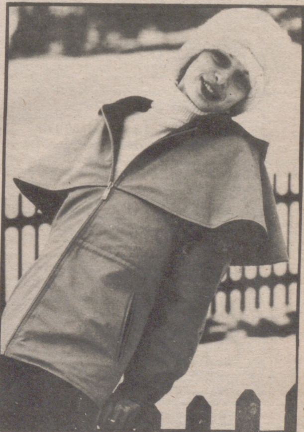
Elegante anorak con capa-capucha, realizado en gabardina de puro algodón impermeabilizada, color kaki, con forro de rizo algodón. Creación Anne Marie Beretta para Skimer, Francia.

Las posibilidades de la pana, bien sea ésta de bordón fino o grueso, lisa o estampada, son inmensas. En todos los casos recomendamos sobriedad en líneas, puesto que la moda deportiva pide libertad de movimientos ante todo evitándose siempre a la hora de adquirirlo confeccionarse conjuntos de este tipo el excesivo ajuste. La línea recta es la más adecuada.