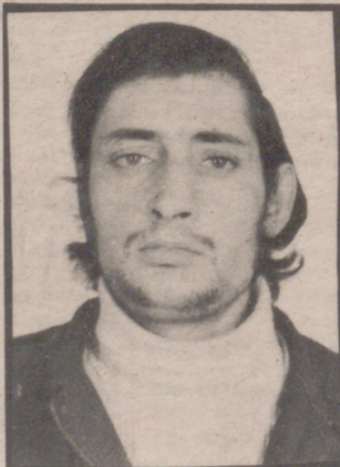
El detenido, con las diligencias instruidas, pasó a disposición de la Autoridad Judicial correspondiente.

Se continuaron las gestiones necesarias para llevar a cabo la localización y detención del presunto autor, que si bien en principio se creyó se había ausentado de esta capital, posteriormente se supo se hallaba deambulando por diferentes puntos de la ciudad, montándose las correspondientes vigilancias en los diferentes sitios por los que solía acudir, dando como resultado de las mismas su detención en la mañana del jueves.