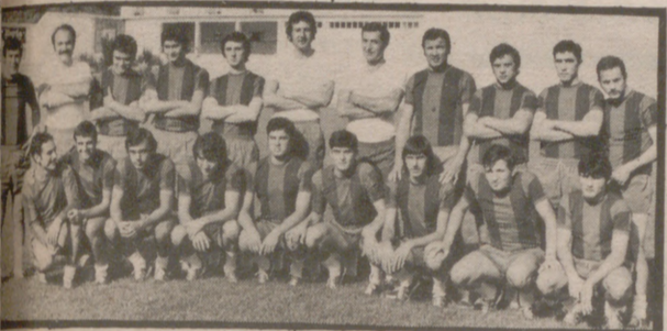
Aragón-Constancia Mallorca-Lérida Poblense-Yeclano Acero-Eldense Tarragona-Olimpico Gandía-Vinaroz Onteniente-Reus Gerona-Huesca Villena-At. Baleares Sabadell-Ibiza

forzosamente al filial zaragocista, sobre todo si consideramos que en el fútbol no existe el enemigo pequeño y que en nuestro grupo las diferencias entre todos los participantes son escasas.