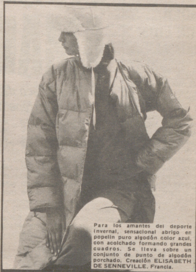
Para los amantes del deporte invernal, sensacional abrigo en popelín puro algodón color azul, con acolchado formando grandes cuadros. Se lleva sobre un conjunto de punto de algodón porchado. Creación ELISABETH DE SENNEVILLE, Francia.

aire puro de las alturas. Hombres y mujeres encuentran en las pistas nevadas distracción, sosiego y vida sana. Y encima, las damas ocasión para "epatar" si viene al caso, a sus amigas.