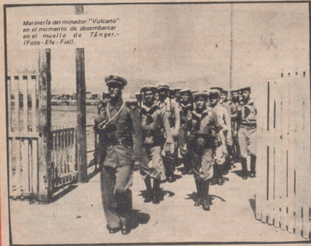
Marinera del minador "Vulcano" en el momento de desembarcar en el muelle de Tánger.

tenemos un novelista". Contaba Ignacio que se había impuesto la disciplina de escribir todos los días 10 cuartillas, con lo que pudo terminar la novela en el tiempo preciso.