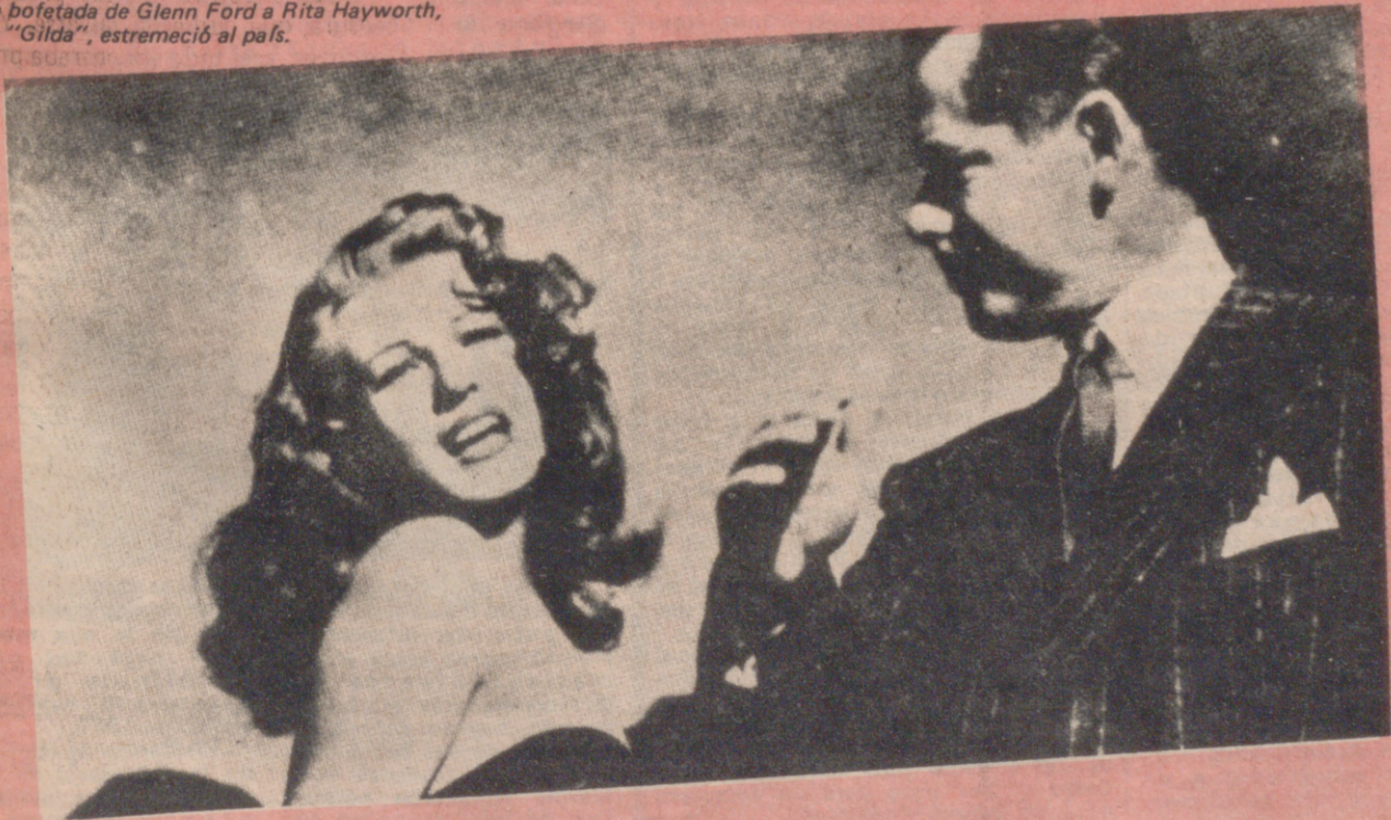
La bofetada de Glenn Ford a Rita Hayworth, en "Gilda", estremeció al país.