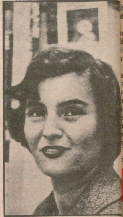
Carmen Laforet ganadora con su novela "Nada" del primer Premio Nadal.

Durante su "larga temporada en Suiza" Ignacio Agustí aprovechó para escribir Mariona Rebull, una de las novelas más importantes de los últimos 30 años. El éxito del libro fue total; y el maestro Azorín lo saludaría con aquella frase lapidaria y definitiva: "Por fin