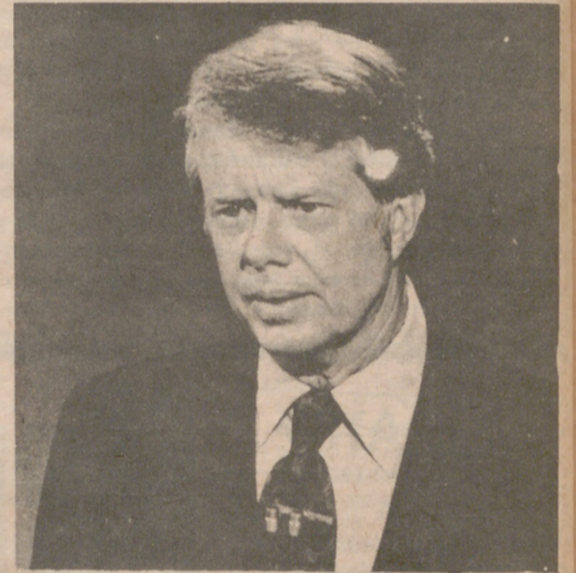
WASHINGTON, 1 (Crónica de Lars ERIK NELSON, especial para ARAGON/express.)

Y vestirá en la ceremonia un traje normal