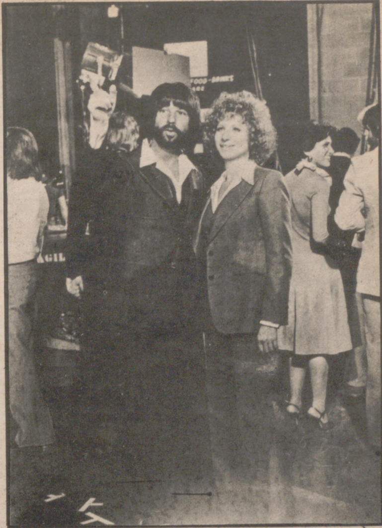
Jon Peters y Barbra Streisand durante el rodaje, muy accidentado, de "Ha nacido una estrella".