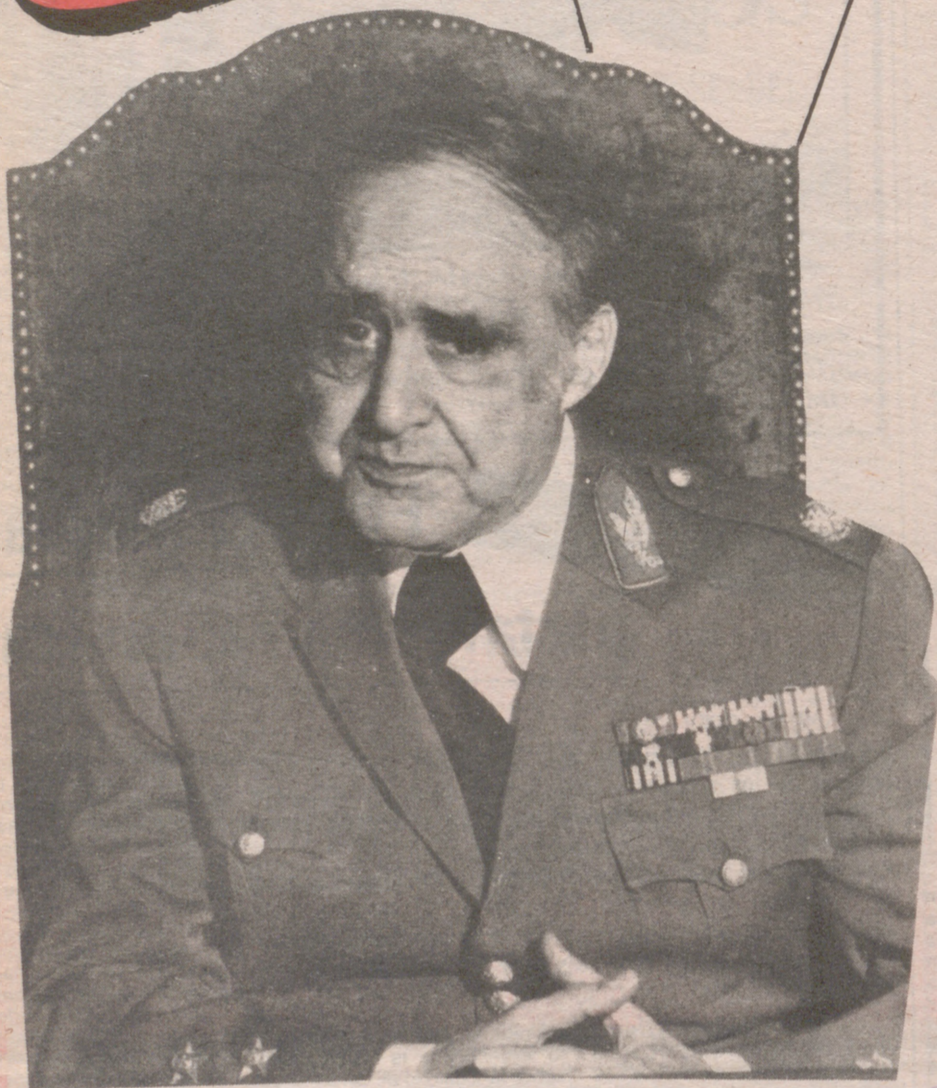
Sus horas de mando