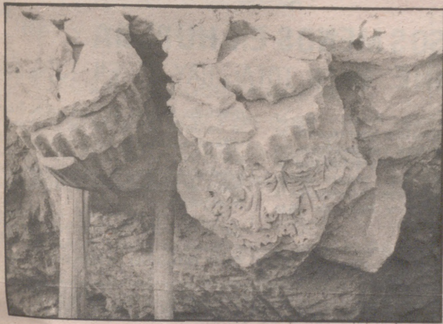
¿Cuántos siglos llevan enterradas estas piedras?

● Es posible que el teatro romano sea, en su género, uno de los edificios mejor conservados en nuestros días