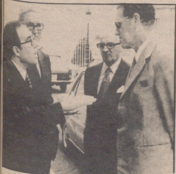
En la foto, el ministro belga y acompañantes son recibidos en el aeropuerto por el Sr. Oreja.

SAN SEBASTIAN, 13 (Logos).— El ministro belga de Asuntos Exteriores, señor Renaat Van Elslande, mantuvo ayer conversaciones de trabajo con su colega español, don Marcelino Oreja en la sede del Ministerio de Jornada.