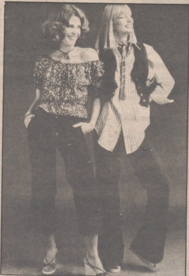
Una blusa en algodón de diminuto estampado floral (a la izquierda) y una camisa de hombre en algodón listado (a la derecha), sirven de complemento a los pantalones de sarga jean que lucen ambas modelos. Creaciones BHS y MARKS & SPENCER, Londres.

Juventud y "Jeans" es casi sinónimo. Por eso