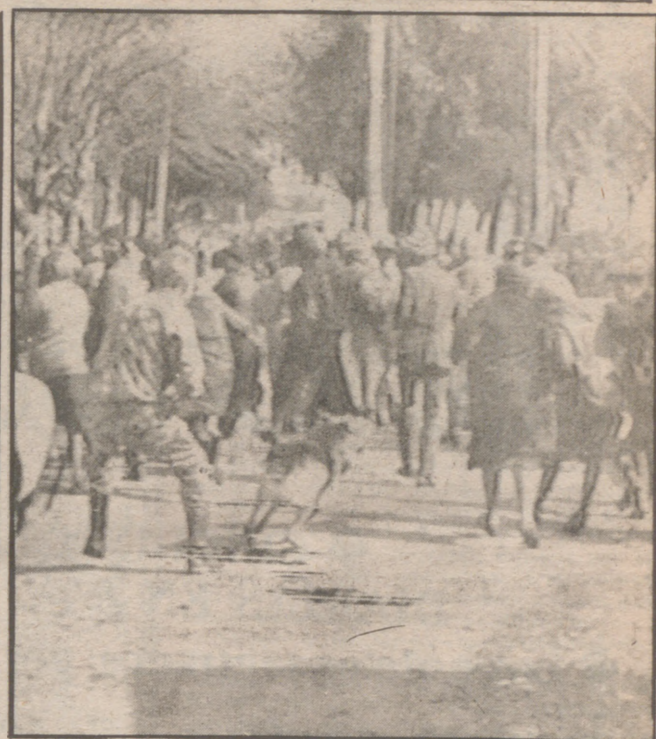
CIUDAD DEL CABO. - Policias con perros bati-disturbios disuelven una manifestación de la población negra convocada contra el Gobierno blanco de Ian Smith.

"Los habitantes de Mykonos eran pobres, antes del boom y temen volver a su pobreza" - dice Orozco. "Pero no debieran llegar hasta vender su escala de valores, y devastar su medio ambiente. Mykonos es la Venecia de Grecia. Debiera salvarse de que se hunda bajo su propia codicia".