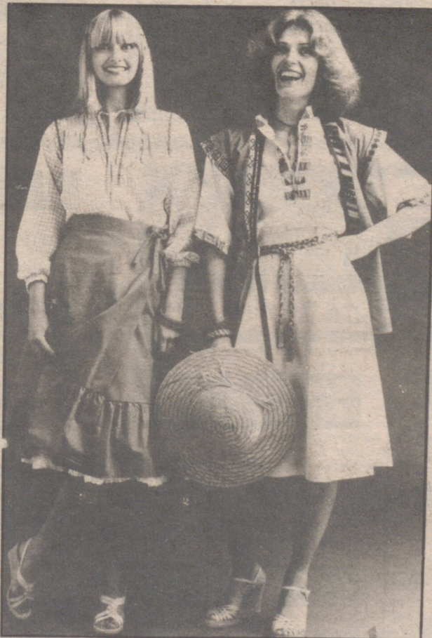
Inspirados en el folklore campesino, dos alegres conjuntos realizados en tejidos de puro algodón. Los adornos del modelo de la derecha son de clara inspiración azteca. Modelos C & A y ETAM, Londres.

nuestra primera descripción arranca de esa premisa. Los dos modelos llevan "Jeans" de sarga tejana cien por cien algodón. Una de ellas lleva como prenda superior una blusa de inspiración mexicana, con los hombros al descubierto y cortas mangas realizada en batista estampada de algodón con diminuto estampado floral, llevando volante alrededor del amplio escote. Se ajusta con cordón forrado de la misma tela. El otro modelo se completa con larga camisa de "hombre" abierta de arriba abajo, en popelin blanco con listas rosas. Las variaciones sobre estos temas son... infinitas.