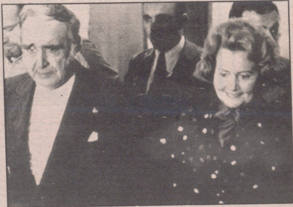
Brasil: amargo exilio

Pocos meses después, en septiembre, Spínola dejaba la presidencia ante las importantes muestras de descontento popular. Durante medio año, de septiembre a marzo de 1975, Spínola se mantiene en silencio y retirado, aunque los comunistas y otros partidos más a la izquierda no dejaron de señalarle como una de las personas más influyentes en el auge y la vuelta de las fuerzas de signo netamente derechista. Eran los momentos en que el Gobierno provisional preparaba las elecciones a la Constituyente que tendrían lugar el 25 de abril de 1975. Pero un mes antes, el 11 de marzo, Spínola