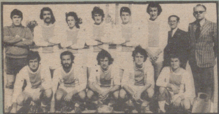
Selección Segunda Regional

71. En total, una cantidad que se aproxima a las veinte mil pesetas. Deseamos al pundonoroso jugador un rápido y total restablecimiento.