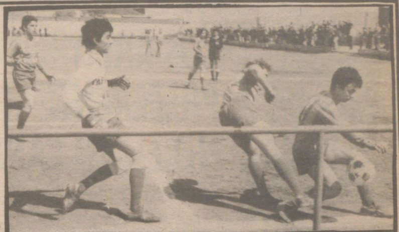
Hormigo, Castilla y Mariano, tres juveniles que triunfan en 1.ª Regional, con el Oliver

No pudo puntuar el Boscos en Zuera, entre otras cosas porque el equipo que dirige el amigo Larraz a pesar de tener seis bajas en la plantilla se encuentra magníficamente preparado como pudo verse el domingo.