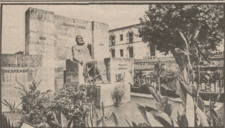
EL LUNES EN GRAUS

En la información que ayer publicábamos sobre la presentación de la Democracia Cristiana Aragonesa se deslizó una errata involuntaria por la que, donde debía decir "miembros militantes del futuro partido democristiano", decía "miembros militares". Confiamos en que los propios lectores habrían subsanado el error.