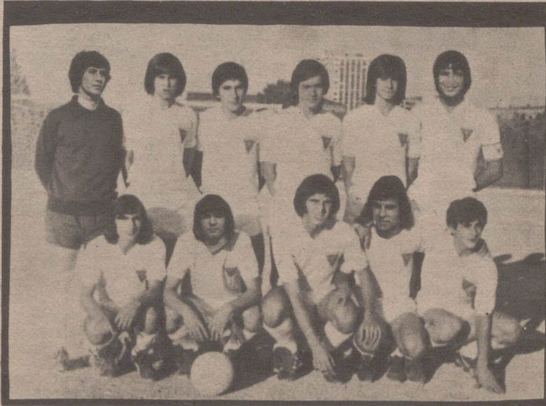
Sobre el papel el Juventud tiene el encuentro más fácil, no sólo por la diferencia de categoría, sino por su potencial que se perfila en su bloque para la preferente.