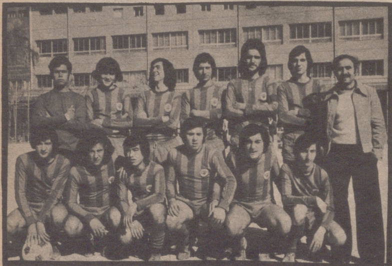
El Boscos tendrá una buena piedra de toque. Debe vencer, porque jugará en su campo, y ya ha conquistado dos veces el trofeo y su actuación puede reflejar sus aspiraciones para la presente temporada.

A LAS 4'30 AHINKO - JUVENTUD 6'15 BOSCOS - STADIUM CAS