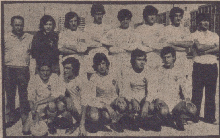
El Ahinko ganó en una ocasión el torneo que organiza, y aunque difícil puede imponerse mañana a su rival, pues en los torneos veraniegos cualquier resultado es posible entre los fuertes.