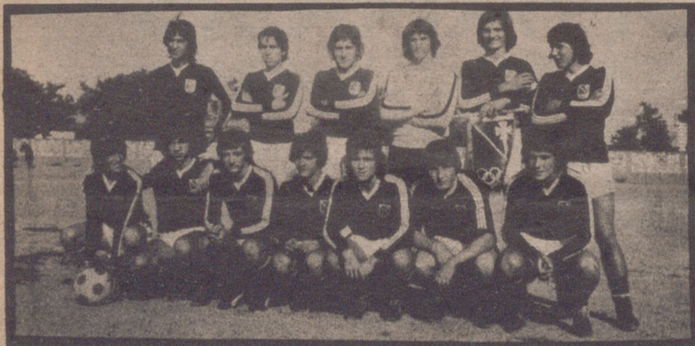
El Stadium puede ser uno de los equipos animadores de la temporada, y ya frente al Boscos puede demostrar que a pesar de su juventud, posee un bloque muy compacto, y capaz de dar la sorpresa ante cualquier rival.