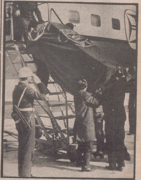
LOS RESTOS DE HUMBERTO DELGADO, A LISBOA

Los oficiales no habían recibido orden para obrar de esta manera. Por lo que tuvieron que desistir inmediatamente de su operación, apenas llegó la noticia a Washington.