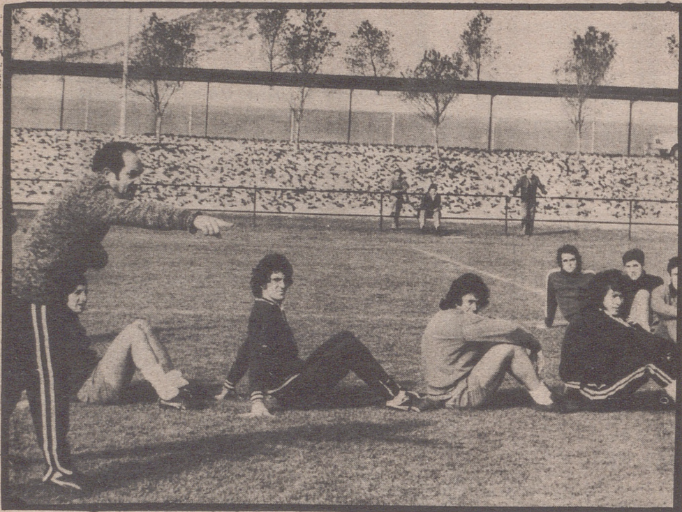
El "mister" zaragocista, dando instrucciones a sus jugadores en el entrenamiento mañanero de ayer, celebrado en la Ciudad Deportiva.

LOS JUEGOS DE CARRIEGA.— LOS JUVENILES A GALLUR.— ¡NO MAS PRESIDENTES CON PURO! — LEIROS Y EL ESPAÑOL.— DESCANSO PARA PLANAS.— EL LENGUAJE DE ARRUA Y SOTO.— NO HAY ALINEACION.—