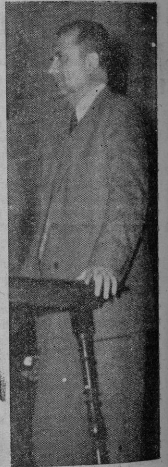
Un momento del discurso del Excmo. Sr. Correa Veglison