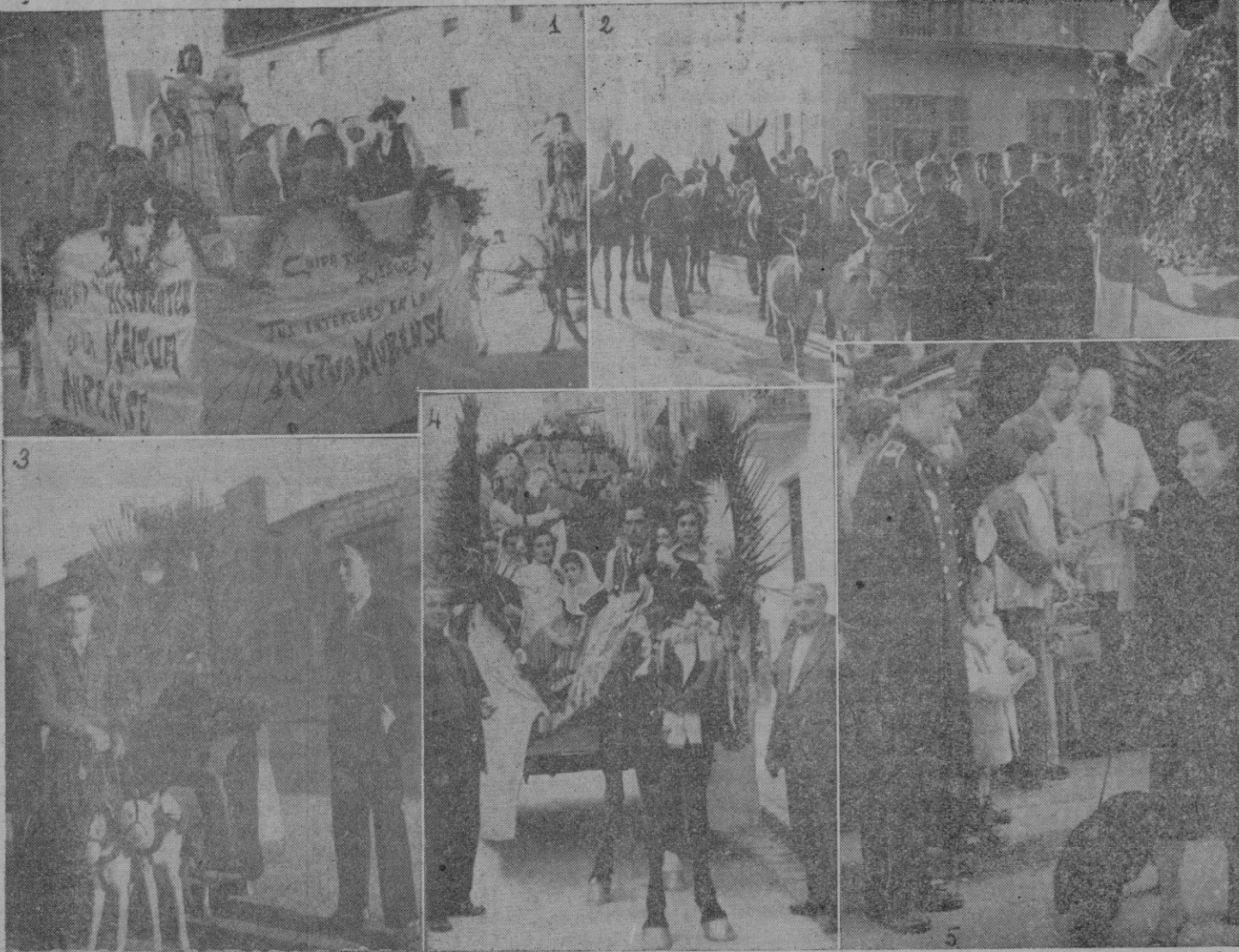
El objetivo de Ferrer ha captado diferentes momentos de la fiesta tradicional. — Los números 1, 2 y 3 recogen la fiesta en Muro; el 4 la de Buñola y el 5 la de Palma

(Viene de la 7) equipo, si hay uno para cada puesto y responden bien?