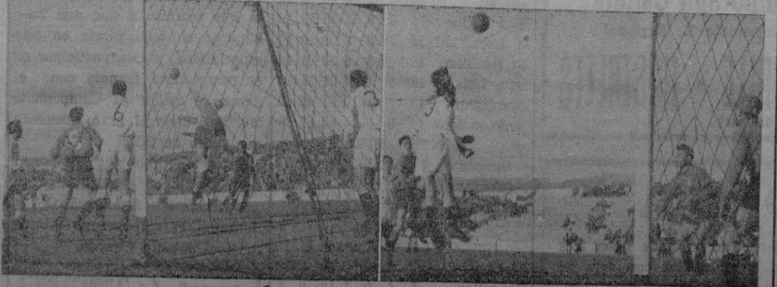
Dos momentos del encuentro jugado en el camp de «Es Forti» entre el Mallorca y el Linense, que acabó con el triunfo del primero por 2 a 0