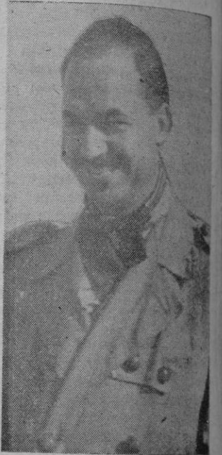
El Presidente de la Federación Motorista Española don Nicolás Rodil del Valle

—El mejor fruto que puede dar, a mi entender, es conseguir una fórmula ideal que permita atraer hacia nuestra Federación, la gran masa de motocicletas que aun no figuran en ella. ¡Si esto se logra