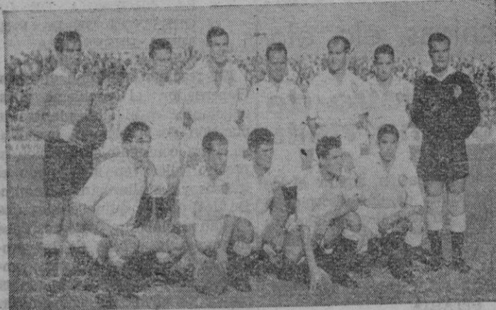
El equipo del Jaén «líder» del segundo grupo de la segunda división

*** No hay duda de que la II División tiene un equipo «puntero»: el Jaén. Este equipo es un buen adalid del grupo Sur,