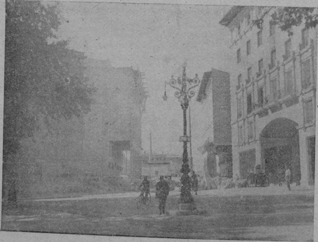
Lentamente van avanzando las obras de lo que ha de ser la avenida del Rey Jaime III. Estos días ha sido derribada la illeta del Borne que taponaba buena parte de la entrada de la nueva vía que ofrece ahora la perspectiva que captó el objetivo de Ferrer