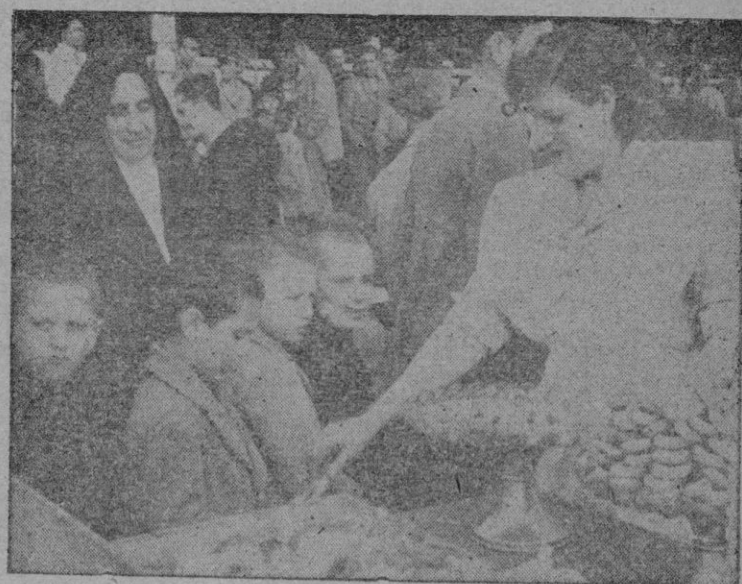
Grupo de pequeños frente a un puesto de churros cuya garbosa dueña les obsequia generosamente, mientras la religiosa observa con bondadosa sonrisa la escena