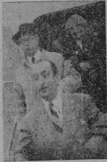
El señor Rodríguez de Valcárcel desciende del avión