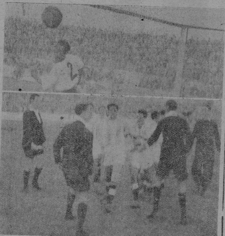
El momento de conseguir los locales su segundo tanto, el que no pudo evitar el defensa alcoyanista que intentó cubrir la meta. — Abajo se ve al árbitro y ayudantes cuando se produjo el incidente que citamos en la reseña del encuentro