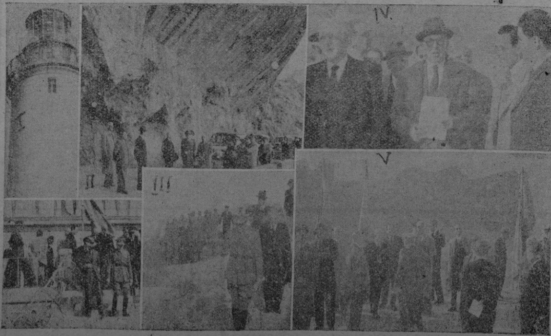
I: Un grupo de invitados al pie del Faro de Formentor. - II: La entrada del túnel que atraviesa el monte Pumat. - III: Las autoridades en uno de los miradores del camino. - IV: El Director General de Carreteras y el Ingeniero Jefe de Obras Públicas con los toreros que prestan servicio en el faro. - V: Las autoridades en la terraza del Faro admiran el soberbio paisaje.