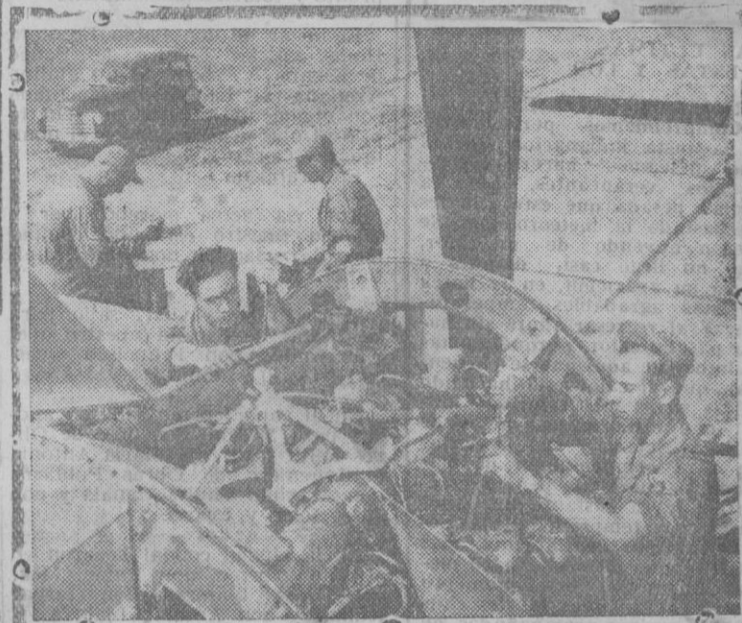
El grupo de transporte americano Núm. 433 para el transporte de tropas llegará pronto a Europa para ponerse a las órdenes del general Eisenhower. La unidad está equipada con aparatos C-119 "Flying Boxcars" capaces de transportar cada uno 64 hombres completamente armados y equipados.