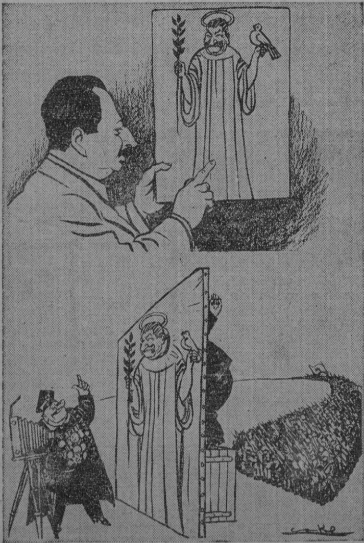
UN VIEJO TRUCO FOTOGRAFICO

Stalin sabe explotar con gran habilidad los errores tácticos de los aliados y cualquier paso que den en falso, para presentar a los occidentales como instigadores y provocadores de la guerra. Ahora, con motivo del intercambio de notas entre los gobiernos occidentales y Moscú. Los occidentales pueden aceptar las nuevas exigencias soviéticas sobre la realización del Pacto Atlántico, proponiendo en retacha que los cuatro discutan también los pactos y tratados militares que la URSS ha firmado con todos sus satélites, los cuales, en cierto modo, equivalen al Pacto Atlántico en el otro lado del telón de acero. ¿Aceptaría Stalin que en el orden del día de la Conferencia tetrapartita de Ministros se incluya un capítulo sobre las alian-