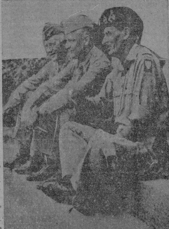
EISENHOWER Y MONTGOMERY EN 1944

Eisenhower ha declarado que todavía queda mucho por hacer en el terreno político y diplomático para la defensa de Europa, pero que el, su segundo, el mariscal Montgomery, y sus adjuntos, asesores y mandos —en los que hay generales o almirantes británicos, franceses, italianos, noruegos, holandeses, daneses, etc.— así como los servicios de su Estado Mayor,