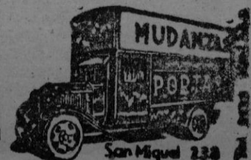
San Miguel 238

Continúan los trabajos para recuperar los restos de los otros dos defensores. Los del aparecido hoy quedaron depositados en la cripta de los caídos del Alcázar, donde recibirán sepultura.—Cifra.