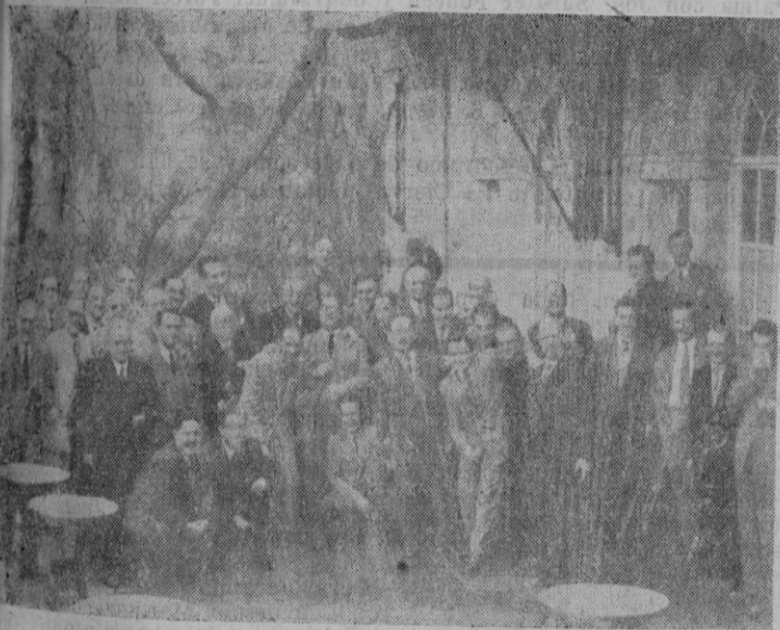
Los periodistas, en la terraza del Riskal, después de la comida de compañerismo celebrada con motivo de la festividad de su Santo Patrón San Francisco de Sales

Lake Success, 29. — El bloque de la doce naciones árabe-asiáticas ha introducido una enmienda en su resolución en favor de una conferencia preliminar con la China comunista para discutir los problemas de Corea y Lejano Oriente. Ha insertado una cláusula en la que se propone que el primer tema a discutir en aquella conferencia sea el relativo a un acuerdo sobre cese de hostilidades en el territorio de Corea.